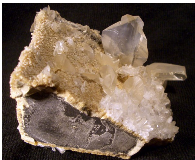
Фото № 3. Друза с кристаллами оптического гипса из участка Джамангуль. Исфаринский р-н.

Но вот дорога свернула в урочище Сагул, где я ещё не был. Долго ехали по сильно всхолмлённой местности и, судя по километражу, уже подъехали к горе Сары-Тоо с вершиной 1774 метра над уровнем моря. Гора эта здесь самая высокая. В глаза бросаются обнажения жёлтых песчаников. Сары – значит жёлтый. Сомнений нет – это и есть гора Сары-Тоо. А вот в нескольких километрах от неё к северо-западу - горы Алты-Курун и Босого-Таш. Босого-Таш выделяется обнажениями крепких известняков на вершине. Вот мы и подъехали к своим участкам.