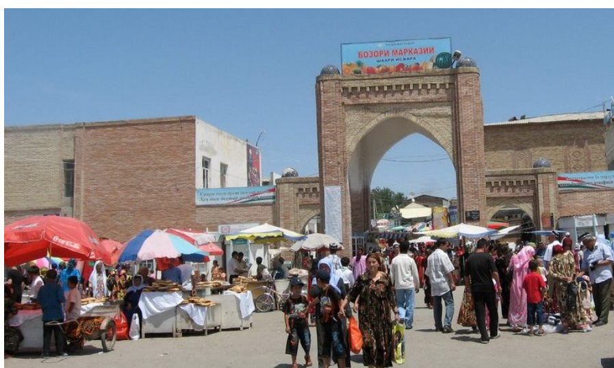
Фото № 10. Центральный рынок в Исфаре.

Субботним утром, наскоро попив чаю, мы отправились к остановке автобуса на улицу Сабитова. Там уже толпились местные таджики, одетые в длиннополые халаты, подвязанные платочками, в тубетейках, в мягких сапожках-ичигах с остроконечными калошами. Эти калоши носили повсеместно все жители востока нашей страны, как женщины, так и мужчины. Калоши с остроконечными мысками и красной подкладкой внутри выпускала старейшая ленинградская фабрика «Красный треугольник». Эти калоши экспортировались во все страны Ближнего и Среднего востока. Практически весь Иран, Пакистан, Афганистан и т. д. ходили в наших советских калошах. Для не мусульман фабрика выпускала калоши с тупым мыском.