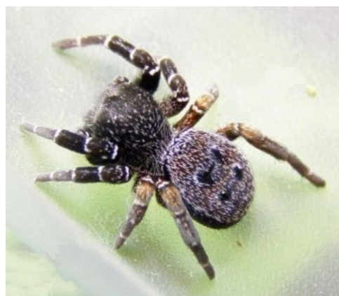
Фото № 4. Ядовитый паук Эрезус.

В отличие от змей, скорпионов, фаланг, сколопендр и других ядовитых тварей, пауки в основном мелкие или очень мелкие. Они не издают предупреждающих сигналов, не изображают воинственной стойки. Они сразу беззвучно кусают. И ты только чувствуешь сильную жгучую боль и через 3-4 минуты парализацию мышц и удушье. Всем известны страшные пауки Каракурт (Чёрная вдова) и волосатый Тарантул. Каракурт чёрненький и маленький величиной до одного сантиметра. Тарантул только в Африке большой, а в Средней Азии он тоже маленький до 3-4 см. А ещё меньшего размера малоизвестный паук под именем Эрезус. Но это его научное название. Местные жители называют его толстоголовиком (Фото №3). У него и, правда, головогрудь больше брюшка. Размер этого паука всего-то 8-9 мм. Попробуй, заметь его в камнях или в палатке.