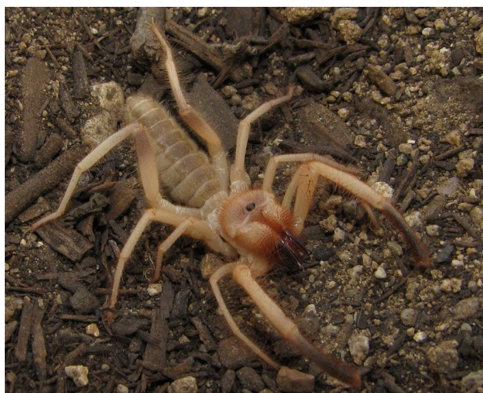
Фото № 8. Среднеазиатская фаланга имеет устрашающий вид.

Когда я подходил к лежащей на земле фаланге, она мгновенно приняла боевую стойку, подняв передние ноги, заскрипела зубами. Но я церемониться с ней не стал. Быстро наступил на неё сапогом и, почувствовав тонкий хруст, повернул мысок сапога, чтобы окончательно раздавить эту ядовитую тварь.