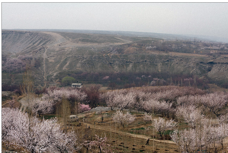
Фото № 1. Окраина Исфары в марте. Цветущие абрикосовые сады.

Шофёр вылез из машины, открыл калитку, вошёл на крыльцо балка и отпер дверь. Никакого света внутри строительного балка не было. Мы с рюкзаками в нерешительности стояли у раскрытой настезь калитки. Тельяс несколько минут покопался в тёмном балке и зажёл там керосиновую лампу. Фары машины по-прежнему освещали крыльцо. Жмурясь от яркого света, на крыльце появился Тельяс и позвал нас зайти внутрь.