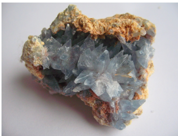
Фото № 5. Жеода целестина из мергелей верхнего мела. Алты-Курук 1977.

залегали зеленовато-серые мергеля с прослойками гипса. Среди этих мергелей верхнемелового возраста часто встречались желваки и прожилки сливного целестина. Это был продуктивный горизонт. Но, кроме сплошных агрегатов целестина, иногда встречались жеоды с грубыми большими (до 5-6 см.) кристаллами целестина тёмно-голубого цвета (фото № 5). Конечно, эти кристаллы нельзя было сравнить с прекрасными по изяществу и цвету целестинами из точек «Тригопункт», «Аэропорт», «Джамангуль». Но цвет этих грубых по форме кристаллов был яркий и не тускнел на солнечном свете. Пробы, отобранные из мергелей этих слоёв, имели повышенное содержание стронция. Ниже зеленовато-серых мергелей залегала мощная пачка слоёв песчаников красного, жёлтого, белого, бледно-зелёного цветов с мощными прослойками розового гипса-селенита.