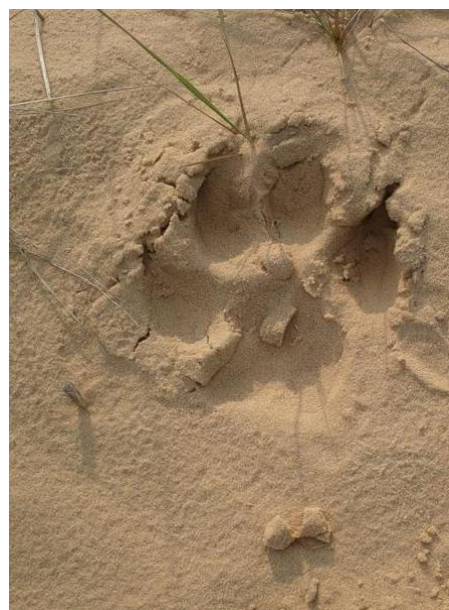
Фото № 9. Свежий волчий след на песке.