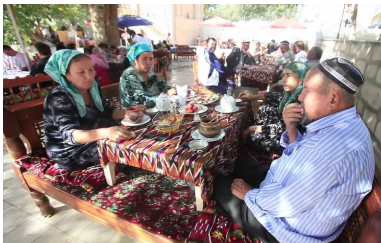
Фото №11. В чайхане, скинув калоши, сидят на топчане за достарханом.

В краеведческом музее мы были одни. И, как нам показалось, работница музея очень удивилась, увидев нас. Однако с нами она была очень доброжелательна и отвечала на все наши вопросы. Но смотреть в музее было почти нечего. Очень мало истории. В основном коллекция ковров, выпускаемых местной ковроткацкой фабрикой, выставки фарфоровой посуды, восточных кувшинов – кумтан с длинным носиком. Несколько стендов посвящено выдающимся людям, родившимся в Исфаре и партийному руководству Таджикистана.