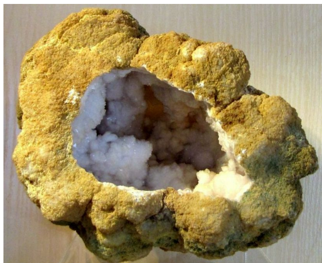
Фото № 6. Секреция с жеодой мелкозернистого кварца в палеогеновых песчаниках. Исфаринский район. 1977 год.

Но тут моё внимание привлекли следы, чётко просматривавшиеся на рыхлом песке. Это был след собаки или волка. Цепочка следов спускалась в овраг. У меня сильнее заколотилось сердце. Мне бы вовсе не хотелось нос к носу встретиться с волком или волчицей. Я прекрасно знал, что волчица никогда не защищает своих волчат, а просто убегает. Но страх меня одолевал. Стараясь держаться бодрячком, я спустился в овраг и тут же потерял следы среди зарослей колючего кустарника.