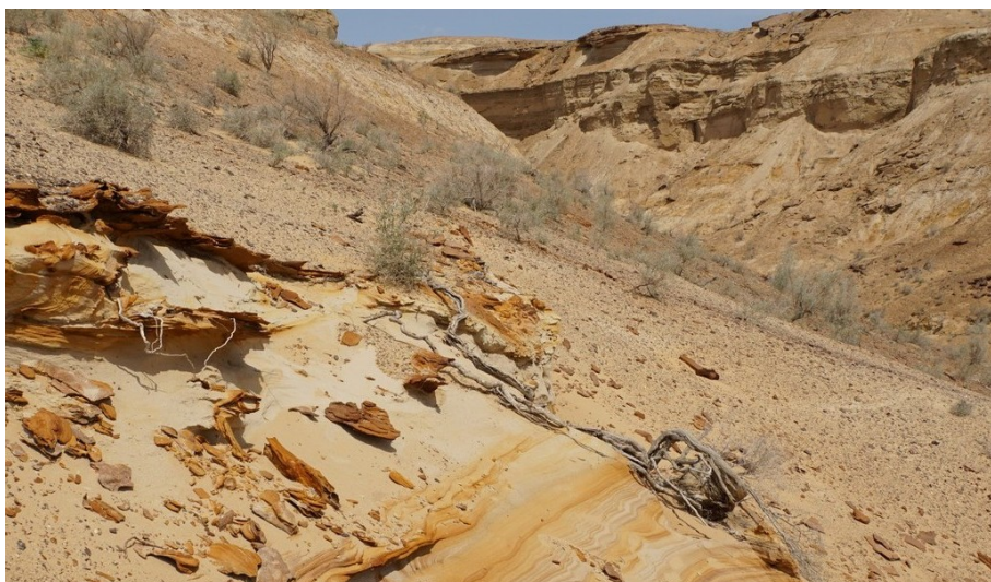
Фото № 7. Древние овраги, прорезающие песчаники мелового возраста.