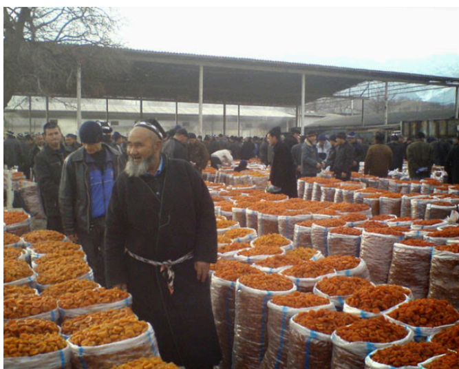
Фото № 12. Продажа сухофруктов на центральном рынке в г. Исфара.

Рыночные прилавки под навесами стояли рядами. Большую часть рынка занимали продавцы овощей и фруктов. Мясо продавалось в кооперативных палатках и колхозных павильонах. Всякими пряностями и приправами торговали на лотках под навесами.