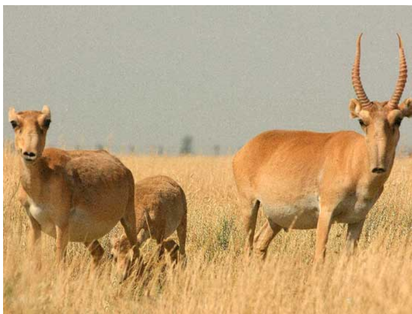
Фото № 11. Сайгаки. Самец рогач и самка с телёнком в степях Казахстана.

Сайгаки – это особенные, уникальные антилопы. Эти парнокопытные животные относятся к семейству полорогих. От слова полые рога. Как раз рога-то и стали причиной их почти полного истребления. Но лучше всё изложить по порядку. Сайгаки примечательны тем, что имеют хоботообразный нос. Странная форма носа служит животному чем-то в виде фильтра от клубов пылевидного облака, поднимающегося от сотен ног бегущих сородичей. Сайгаки - животные полупустынь и степей. Они постоянно кочуют стадами в поисках травянистой пищи весной с юга на север, осенью и зимой, наоборот, с севера на юг. Раньше (с незапамятных времён) сайгаки обитали на огромном пространстве от монгольских степей, казахских полупустынь до степей Калмыкии. В 1950-х – 1980-х годах поголовье сайгаков резко возросло по известным причинам. Не до них было. Наша страна строила Социализм. Сайгаки спокойно гуляли на огромной площади в 123 млн. гектаров. Численность их возросла до невероятных масштабов - свыше 2 млн. голов. И вот, настало время, когда тысячные стада сайгаков стали буквально вытаптывать целые поля пшеницы и других сельскохозяйственных культур.