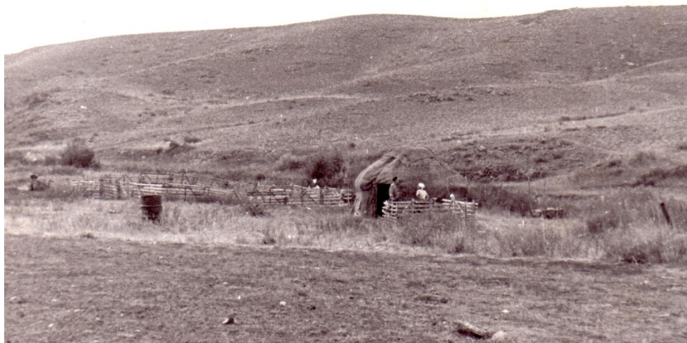
Фото № 12. Казахская юрта на месте стойбища Каратогай в Мугоджарах.

В лагере мы освежевали добычу и нарезали мясо на куски. Печёнку поджарили тут же. Мясо надо было срочно засаливать и консервировать. Большую часть мяса стали варить. Но попробуй быстро съесть 35 килограммов мяса. Это нам шестерым было не под силу. Вездесущие мухи уже почувствовали мясо, и стали слетаться на его запах. Всю ночь мы возились с мясом. Хорошо, что мы не увлеклись охотой и не погнались за другими сайгаками.