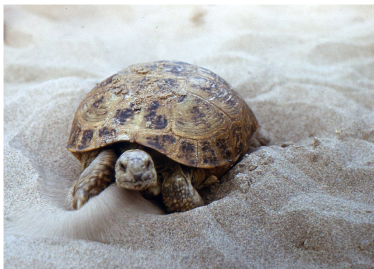
Фото № 8. Среднеазиатская черепаха хорошо чувствует себя в Мугоджарах. Июль 1972 года.

Почему черепахи облюбовали для себя это укромное местечко на песчаном берегу реки Дезды, тоже объяснимо. Черепахи откладывают свои яйца в песок. Песок нагревается солнцем, и создаётся нужная температура для созревания яиц. Пасмурных дней здесь не бывает, и песочный инкубатор выдаёт каждый год великолепный приплод. Родившиеся черепашата бегут сразу к воде. Она здесь совсем рядом. И самое главное, у черепах здесь нет врагов. Маленьким детёнышам ничто не угрожает. Разве только змеи могут полакомиться яйцами черепах. Но, змеям, живущим здесь, вполне хватает пищи и без черепаших яиц. В этом безлюдном краю полно мышей, насекомых, улиток и другой всячины. Во всяком случае, огромное количество черепах, обитающих в одном месте, говорит об их комфортном существовании.