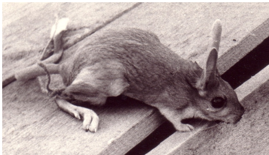
Фото № 5. Испугавшийся тушканчик. Мугоджары. Июнь 1972 года.

из отряда грызунов очень много в Северо-Западном Казахстане. Они ведут ночной образ жизни. И, когда едешь ночью на машине, то иной раз их с десяток прыгает перед колёсами, освещённые светом фар. То ли их завораживает свет, или резкая граница между светом и тьмой им кажется стеной – никто не знает. Но они бегут впереди машины, никуда не сворачивая. Порой они бегут со скоростью до 40-50 километров в час. Невероятно для зверька размером до 25 см. в длину. Говорят, они могут подпрыгнуть на высоту до 2-3 метров. Немыслимо! Кстати, мне позже удалось поймать одного тушканчика на петлю. Я его вынул из петли, привязал к его ноге верёвочку и сфотографировал его. Он от страха хорошо позировал. Затем, сфотографировав тушканчика, я его накормил тушками убитой саранчи. Сначала тушканчик не хотел ничего есть, боялся. Я отнёс саранчу в траву рядом с лагерем и туда же выпустил тушканчика. Почувствовав свободу, тушканчик далеко не убежал. Он спрятался рядом и, выждав время, пришёл полакомиться саранчой.