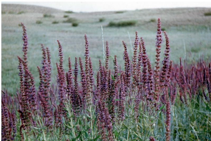
Фото № 2. Цветёт шалфей. Мугоджары. Июнь 1972 года.

Геологи говорили мне, что в окрестностях горы Жиланды-Тау, где расположилась лагерем их партия, очень много карстовых пещер и гротов. В этих пещерах скопище ядовитых змей. Недаром слово «Жалын» означает по-казахски – змея.