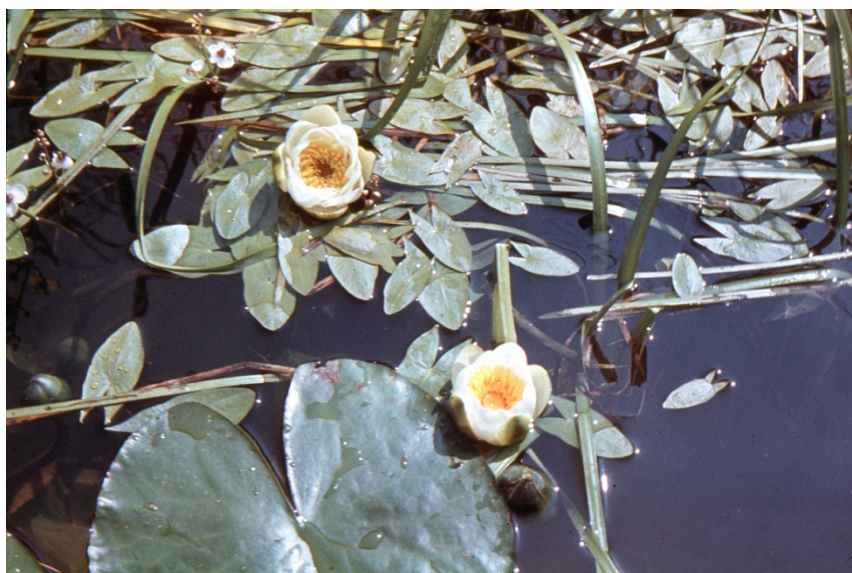
Фото № 6. Кувшинки на реке Кундузды. Мугоджары июнь 1972 года.