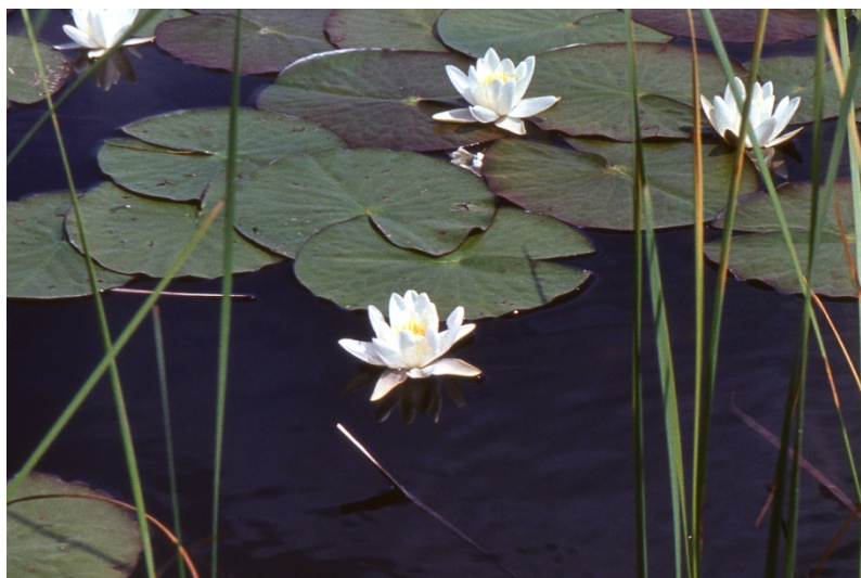
Фото № 9. Белые лилии на реке Дезды. Мугоджары июль 1972 года.

После отлова черепах мы решили искупаться. Берег реки так зарос осокой и другими водными растениями, что подобраться к воде было несколько проблематично. Мы ещё опасались змей, которых могли не заметить в водяной траве. К тому же дно здесь оказалось очень илистое и неприятное.