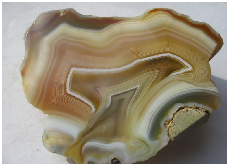
Фото № 10. Полированный разрез мугоджарского агата.