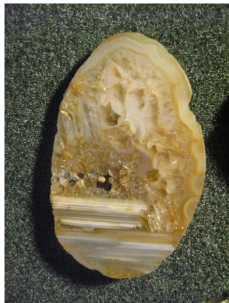
Фото № 4. Полированный мулинский агат.

Ровно в 8 утра я подошёл к зданию шахтоуправления. Дяди Юры ещё не было. Но скоро послышался рокот мотоцикла. Это был старенький мотоцикл «Урал». К машине была привязана лопата и рюкзак.