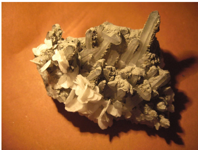
Фото № 6. Кварц с лепестками кальцита. Месторождение Савинское – 5.