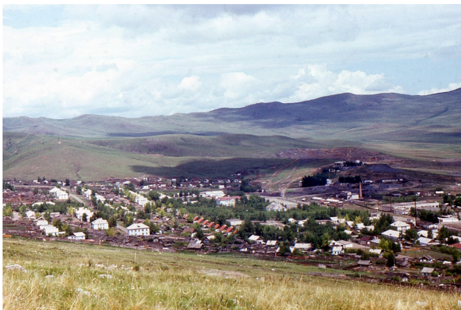
Фото № 1. Посёлок Кличка июнь 1980 год.