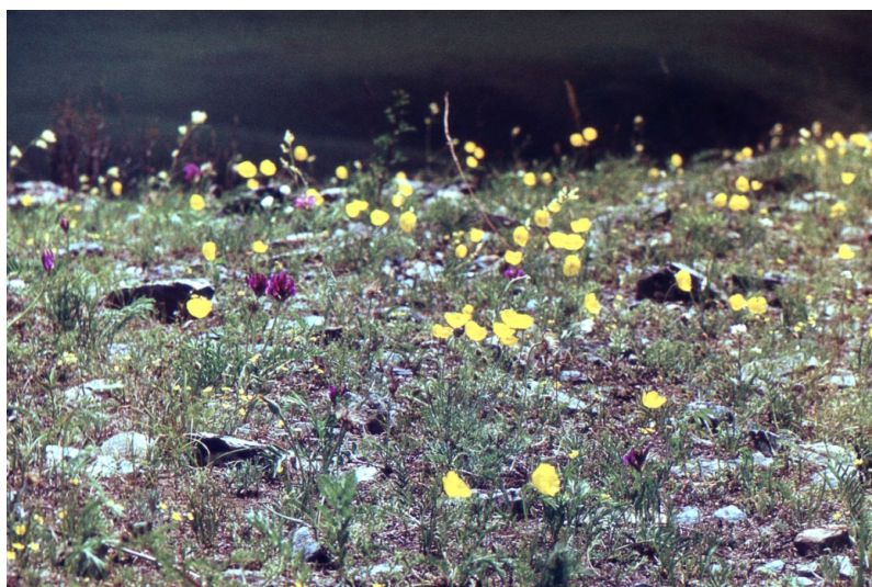
Фото № 9. Жёлтые степные маки. Посёлок Кличка. Май 1980 года.

С небольшими остановками мы поднимались всё выше и выше по лестнице восстающего. Когда уже осталось пройти последний лестничный пролёт, мы услышали сверху голоса и очень этому удивились. К нашему удивлению на устье шахты работали электрики. Они ставили новый вентилятор в вентиляционный ствол. При виде нас электрики очень удивились. Стали расспрашивать, откуда мы взялись? Василенко отшучивался. Но судя по нашему усталому виду, по нашей грязной и разорванной одежде, они поняли, что мы вышли из какого-то переплёта. Бригадир электриков, знакомый Василенко догадался, что мы искали минералы. Но расспрашивать ни о чём не стал, оставив этот разговор на потом.