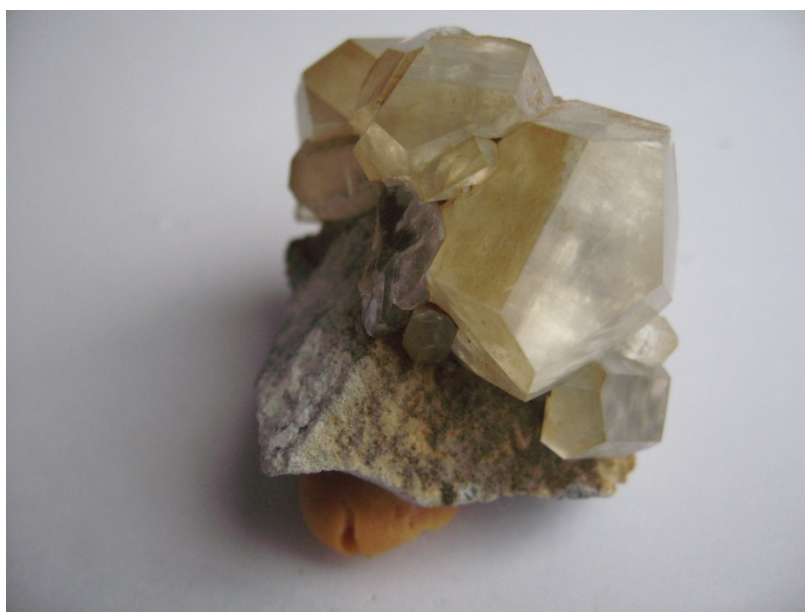
Фото № 7. Прозрачный кальцит из месторождения Савинское – 5.

Этот карст состоял из тех камер. Стенки карста были покрыты большими прозрачными кристаллами кальцита. Величина кристаллов доходила до 10-12 сантиметров. Поистине, музейный размер. Но, кроме прозрачности, кальцит отличался разнообразием форм. Это были шестигранные таблички, толстые лепестки, октаэдры и другие формы. На одной небольшой поверхности были кристаллы нескольких генераций кальцита разной формы и размеров. Рёбра некоторых таблитчатых кристаллов кальцита покрывал микроскопический налёт пирита. Этот пирит блестел под светом фонаря, переливаясь разными цветами спектра.