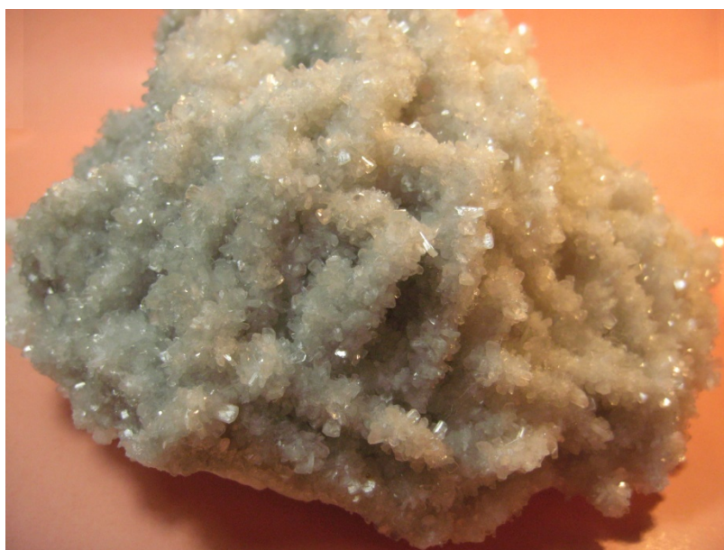
Фото № 2. Друза стильбита блестит как крупный снег. Месторождение Савинское – 5. Кличка 1980 год.

Вот в один из таких природных карстов мы и направлялись вместе с участковым геологом Мишей и пробщиком Ваней. Мы шли по 7 горизонту в обводную (от слова обводить) выработку, которая своим краем вскрыла карст.