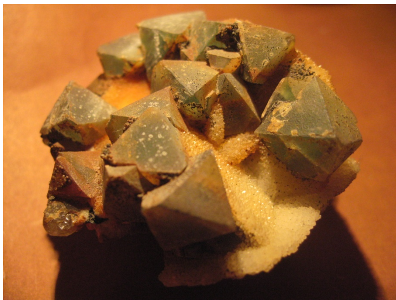
Фото № 8. Флюорит на кварцевой подложке. Месторождение Савинское.