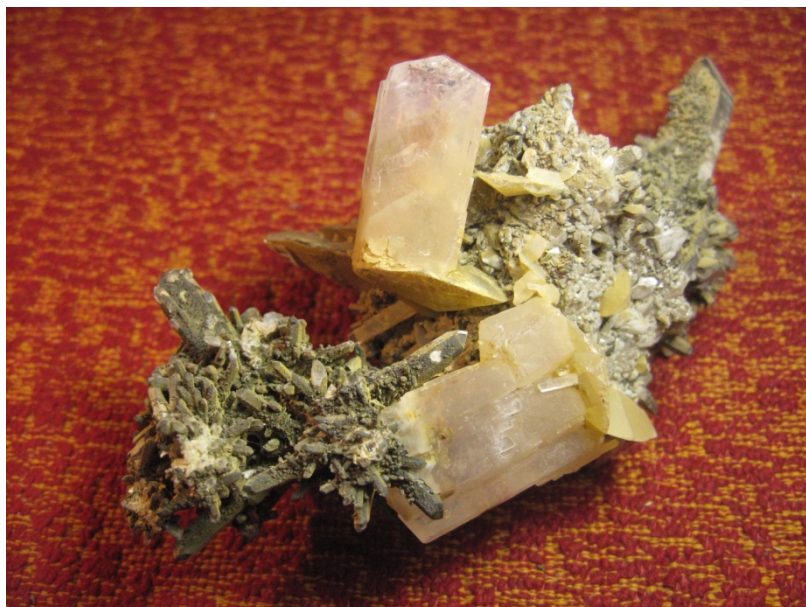
Фото № 3. Кристаллы кальцита на кварце. Кличкинский рудник 1980 год.

Но у Олега была своя заначка. В 2-ом штреке в одном из квершлагов была небольшая полость. Прямо в нижней части стенки квершлага было небольшое углубление, весьма запылённое и с виду не заметное. Олег встал на корточки возле этой ямки, разгрёб молотком мелкие кусочки породы, специально насыпанные сверху, и аккуратно поднял краешек брезента. Под брезентом была белая глина. Вместе с Олегом мы открыли брезент, засыпанный породой, и перед нами открылась полость. Небольшая метр на полтора. Полость заполняла белая кашица похожая на глину. Я спросил, что это такое? Олег ответил, что это «занорыш» в котором должны быть красивые камни. Он уже здесь рылся недели две назад и нашёл неплохие образцы. Но времени тогда было мало, и он заложил и замаскировал эту полость. Вот так делаются «зачачки».