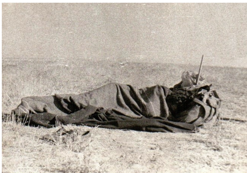
Фото № 10. Ночёвка в пустыне Каракумы. 30 августа 1968 года.

Как нам не хотелось, но пришлось выходить из машины, забрав все свои вещи. Машина съехала с дороги, развернулась и поехала назад. А мы остались одни среди тёмно-коричневых такыров.