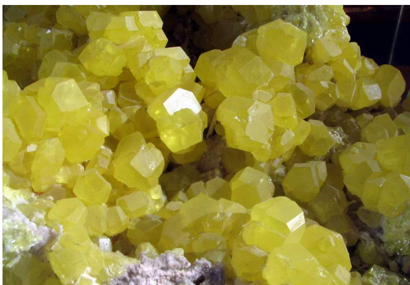
Фото № 7. Кристаллы самородной серы из минералогического музея.

Через час с небольшим мы выбрали весь «занорыш» и на дне канавы осталась тонкая щель с крошками разбитых кристаллов серы янтарного цвета. Дальше разрабатывать жилу уже не было никаких сил, да и время уже подходило к шести вечера.