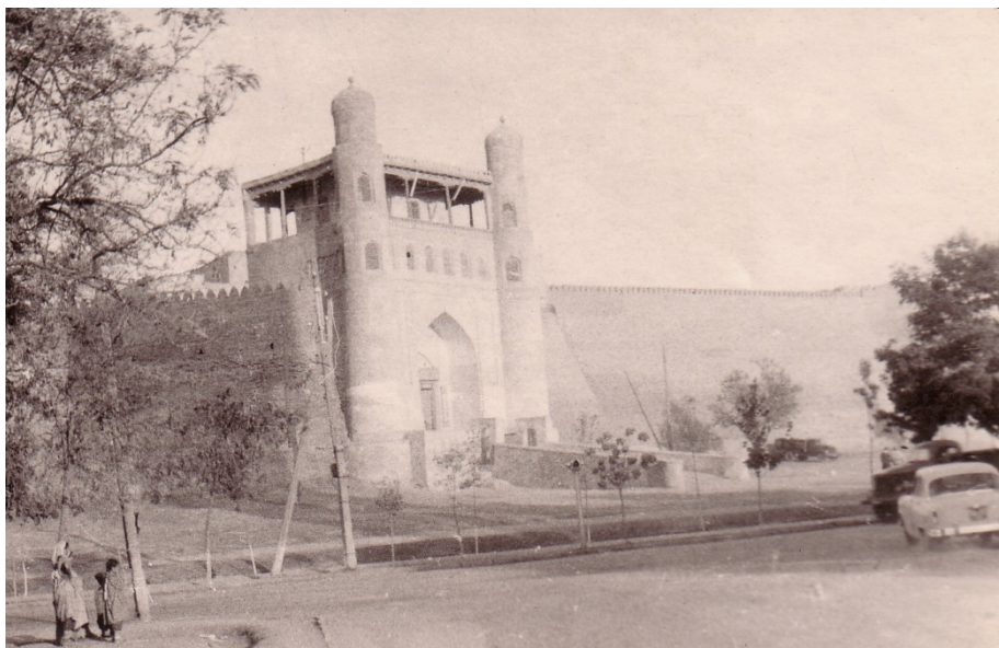
Фото № 4. Город Бухара крепость Арк. 30 августа 1968 года.

коп. На троих на дорогу выходило 19 рублей 50 копеек. Это треть нашего экспедиционного аванса. А нам ещё надо лететь на самолёте в Дарвазу туда и обратно и до Караганды почти 2 тыс. километров. А нам после Дарвазы надо посетить ещё 3 месторождения и отправить отобранные образцы в Москву. Нашего аванса ни на что не хватит. Поэтому мы решили взять билет до первого большого посёлка. Такой станцией на нашем пути был Бельбек. Ехать до него около двух часов. К этому времени стемнеет, и мы сможем спрятаться на третьей полке от проводника. Стоимость одного билета до Бельбека всего 1 руб. 40 копеек. Вполне сносно. Ну, а если всё пройдёт нормально, то перед Ашхабадом мы возьмём у приехавших пассажиров билеты от Красноводска до Ашхабада и приложим их к нашему авансовому отчёту.