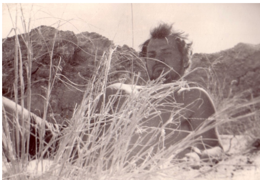
Фото № 6. Я в центре Каракумов. Месторождение серы Серный завод. 22 августа 1968 года.