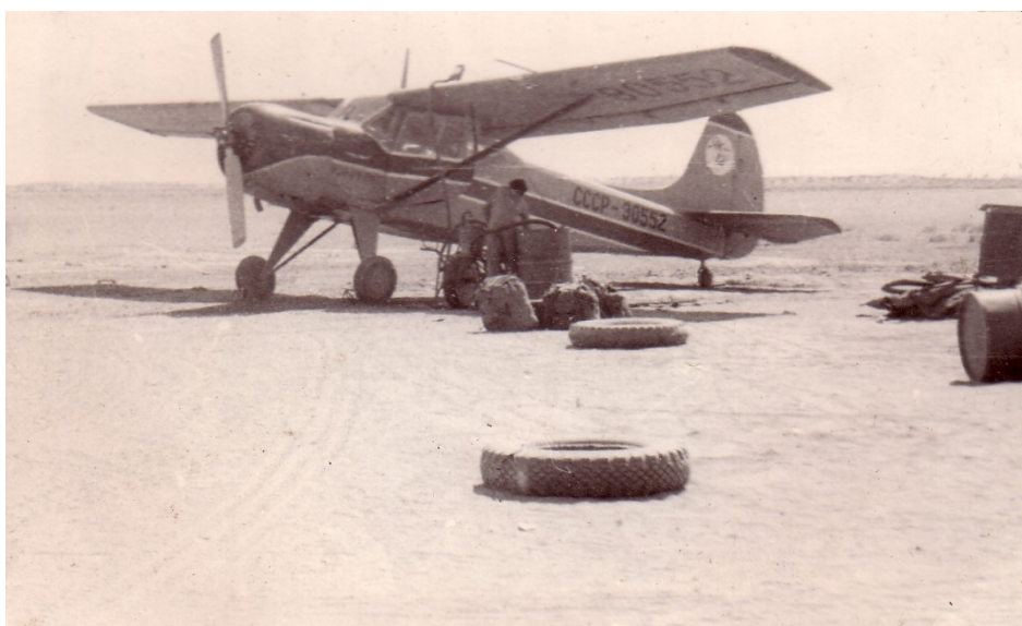
Фото № 8. Самолёт ЯК-12 заправляется. Возле бочки наши рюкзаки. Каракумы Дарваза 23 августа 1968 года.

Конечно, этот кинофильм люди смотрели уже много раз, но, несмотря на это, зрители не расходились. Смотрели с интересом. И даже смеялись над забавными эпизодами фильма. Жители бурового посёлка, наверняка с удовольствием посмотрели бы какой-либо новый фильм, но показывали только то, что у них было в кинотеке. И этому люди тоже были рады.