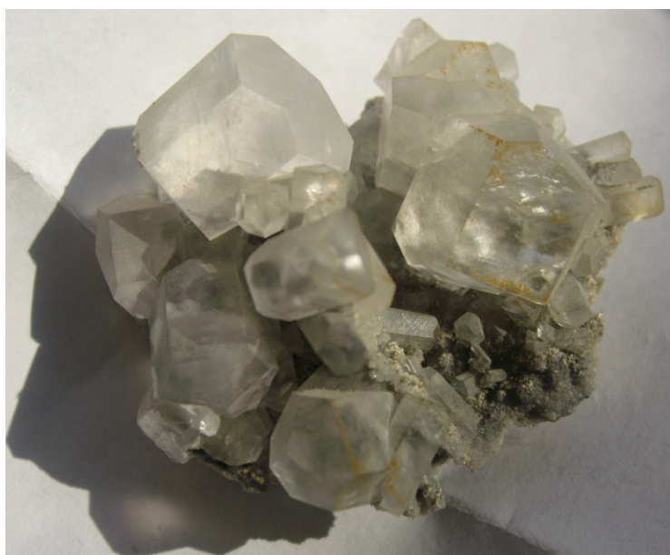
Фото № 6. Прозрачный кальцит с красивыми кристаллами. Акатуй 1985 г.

И вот в стенке карста я увидел узкую щель, с поверхности обросшую кальцитовым ониксом. Я посветил фонариком и увидел в глубине этой щели друзовый кальцит.