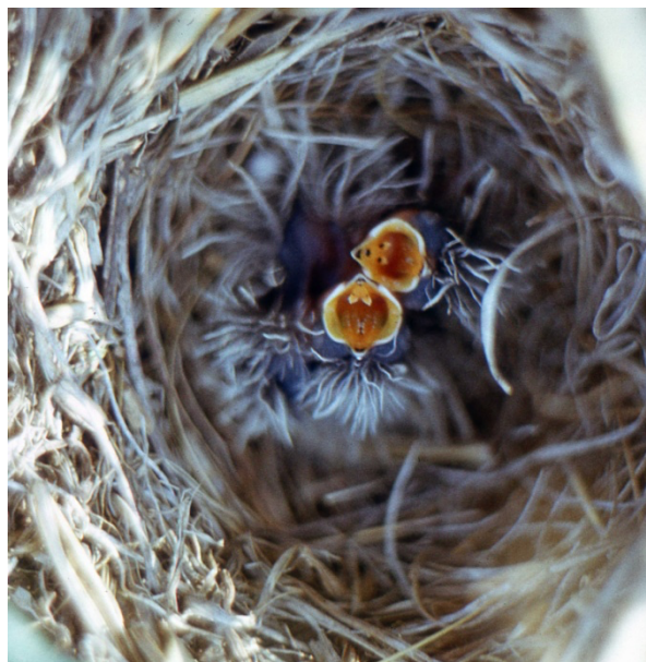
Фото № 2. Птенцы жаворонка. Забайкалье июнь 1985 года.

Сколько раз я находил гнёзда этой маленькой певуньи. Степной жаворонок (джубай) редко садится на ветки. Он постоянно в полёте. У каждой пары своё место обитания, где они выют гнездо. Чужаков отгоняют со своей территории. Плотность населения достаточно большая. Стоит отойти на триста метров от первого гнездовья, как уже другой жаворонок (сосед) встречает тебя своей песней. Наверное, у каждого жаворонка своя песня. Но человеческое ухо не различает оттенки тембра и вокальные особенности песни жаворонка. Во всяком случае, песня любого жаворонка очень звонкая и сложная по звучанию. В ней сочетаются и свист, и чириканье и сложные вокальные коленца. Пожалуй, в наших краях песня жаворонка по своей красоте и многозвучию уступает только соловьиным трелям.