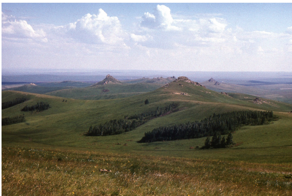
Фото № 3. Нерчинский хребет июнь 1985 года.