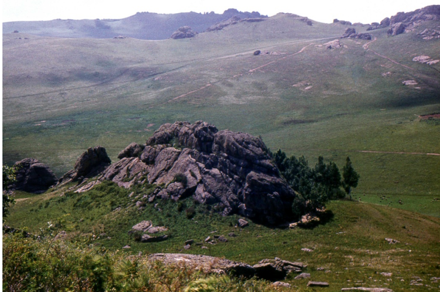
Фото № 4. Дорога к перевалу Нерчинского хребта. Июнь 1985 года.