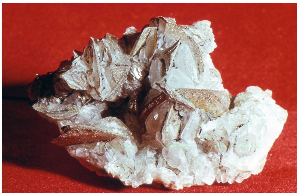
Фото № 5. Друза кальцита с пиритовой присыпкой на гранях.

Когда я спустился, Серёжа показал на сталактиты. Подсвеченные сбоку нашими фонарями, они искрились каким-то неземным светом. На кончике сталактитов висели крупные капли воды. Они на глазах становились всё больше и больше, а затем срывались вниз, булькая в лужицу. С пола навстречу сталактитам, росли сталагмиты. Такого же грязно жёлтого цвета. Всё это напоминало пасть гигантского дракона с окровавленными зубами.