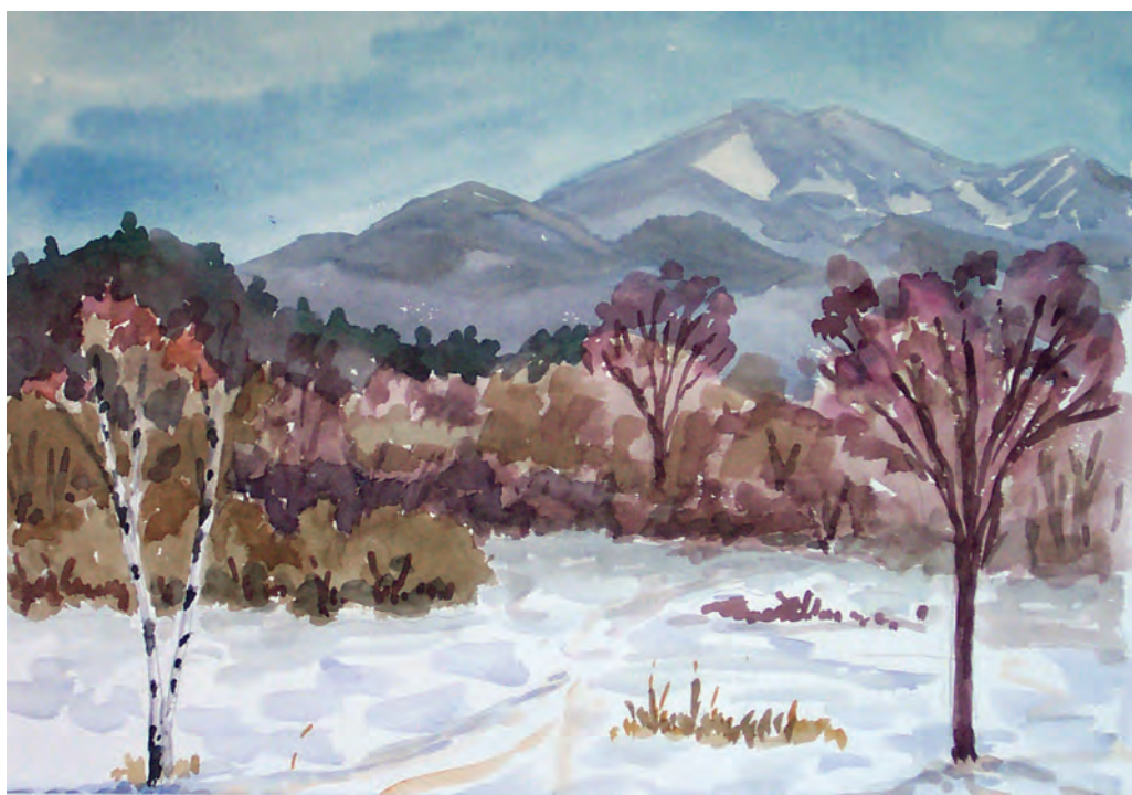
Февраль в предгорьях Ливадийского хребта (1996)