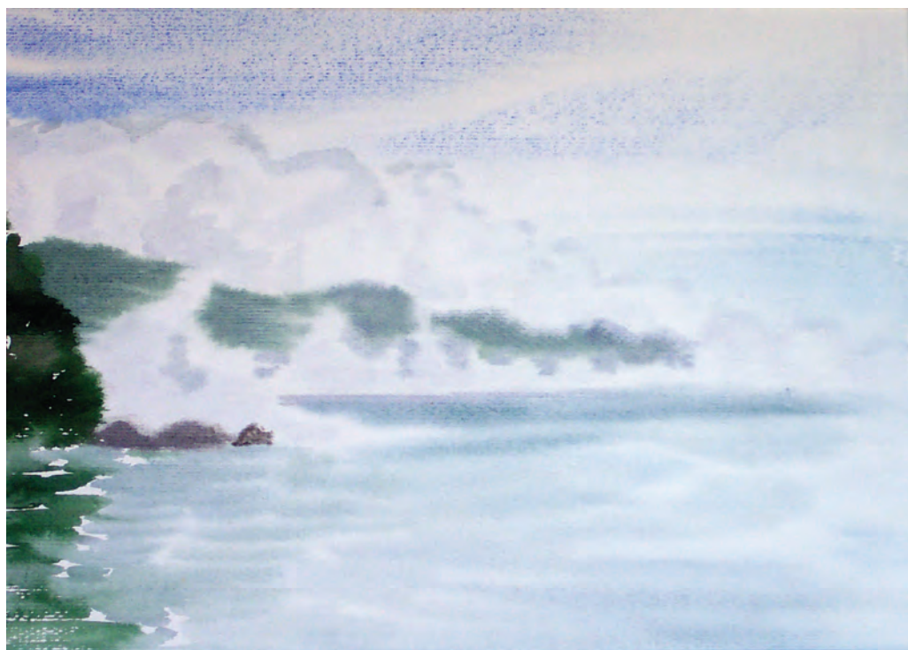
Ускользящее волшебство (2001)