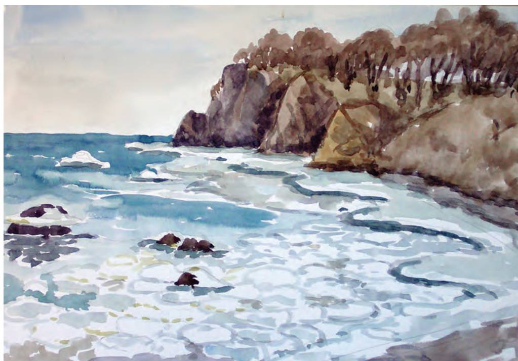
Зима на Уссурийском заливе (1995)