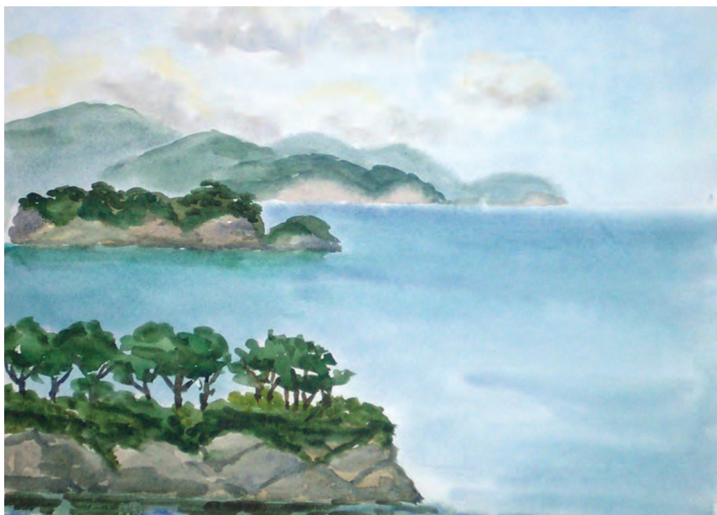
Бухта Спасения. Морской заповедник (2003)