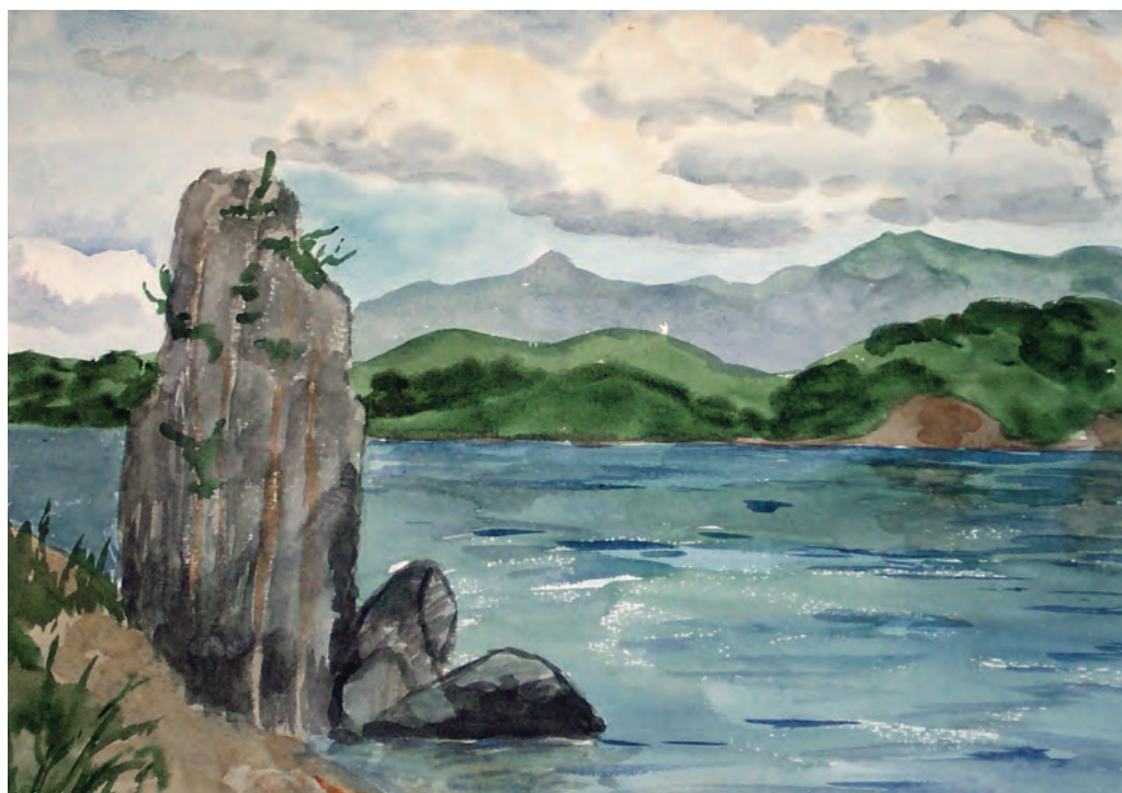
Останец. Бухта Средня (1993)