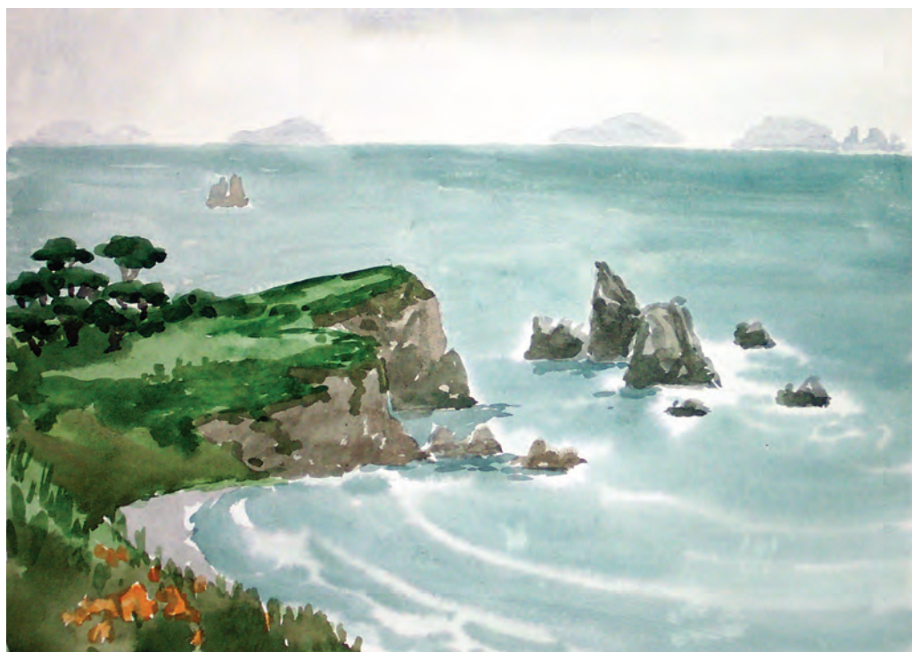
Мыс Астафьева (2003)