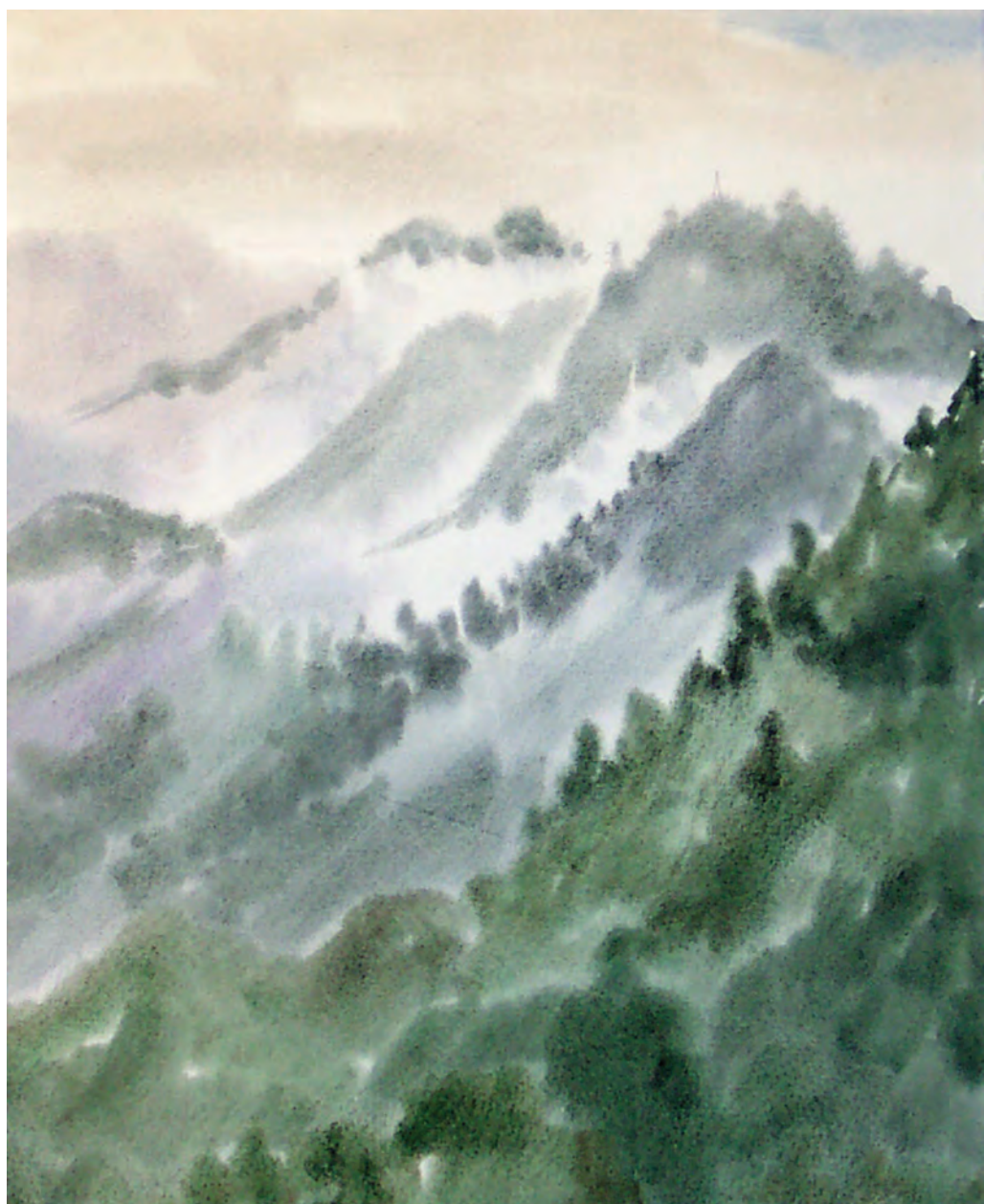
Утро в горах. Дальнегорск (1993)