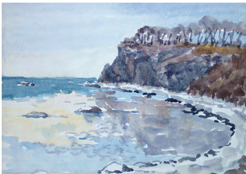
Январь на Уссурийском заливе (1978)