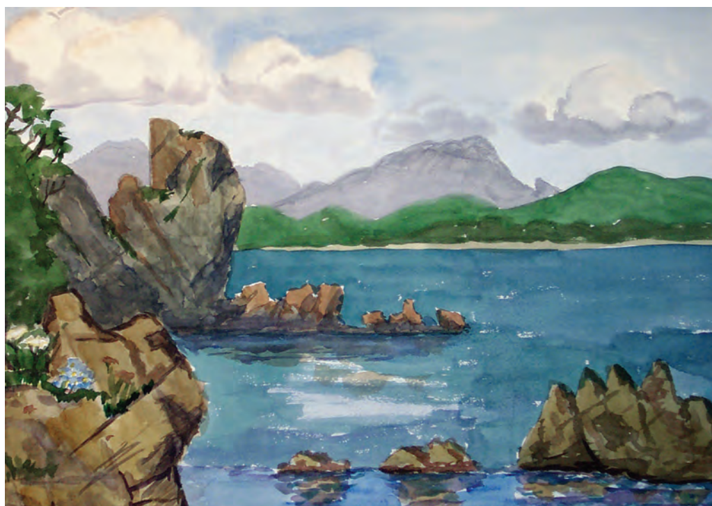
Летний день. Залив Восток (1992)