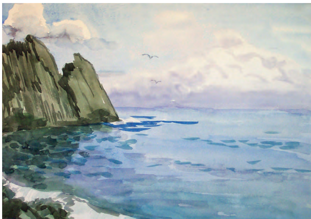
Бухта Соболя. Голубой день (1992)