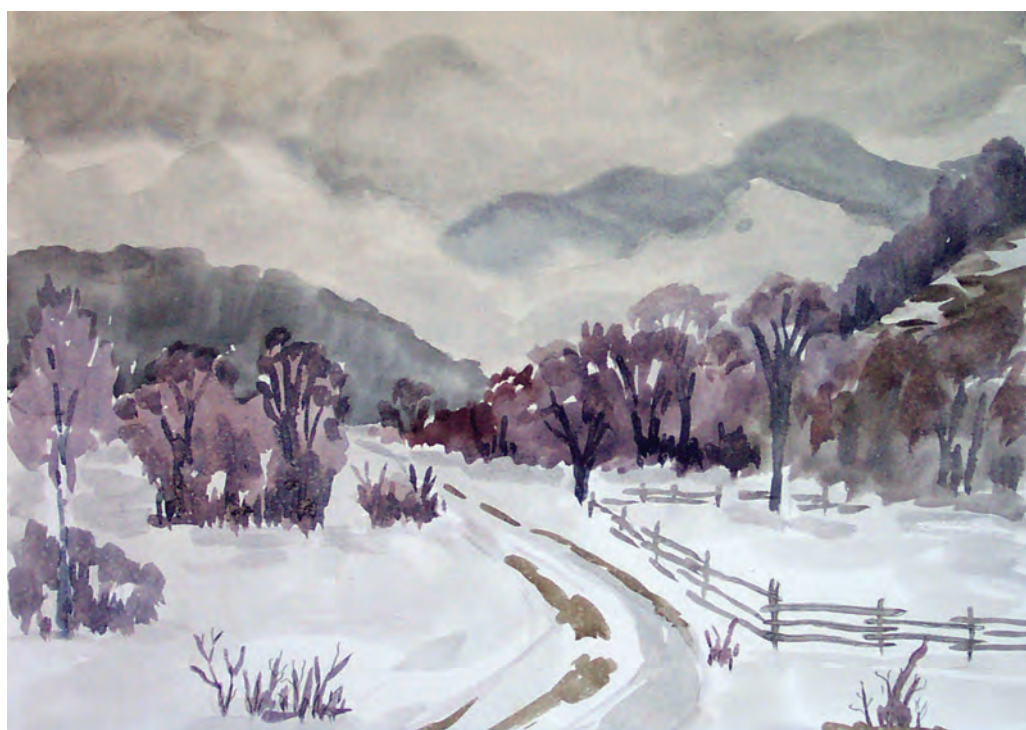
Снежные тучи уходят (2001)