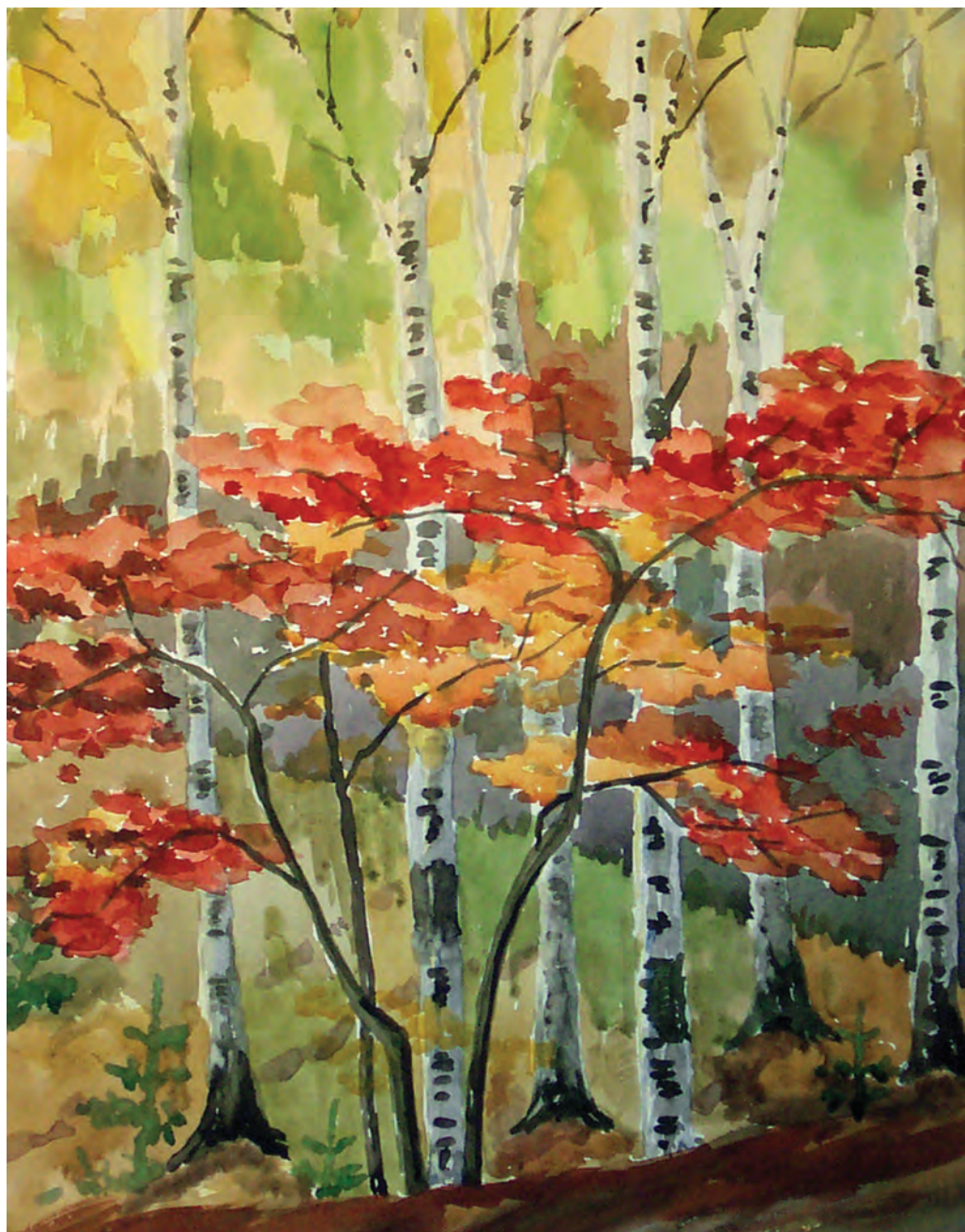
Осень яркая (1980)