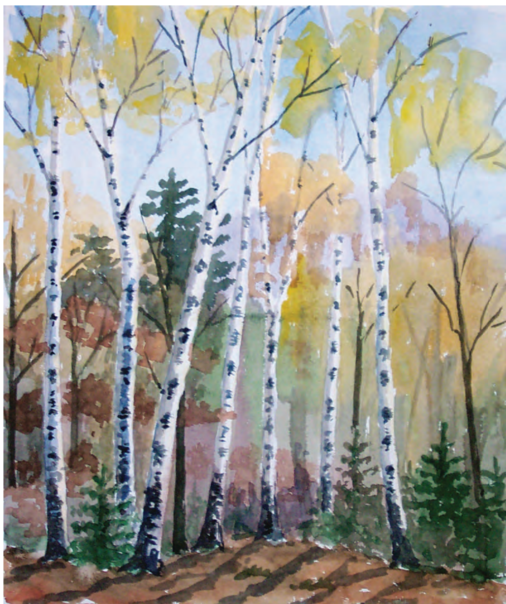
Осенние березы (1990)