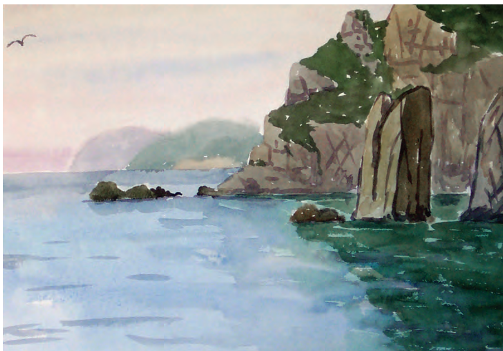
Тихая лазурь (1982)