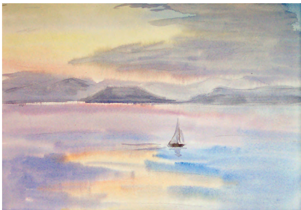
Бархатный штиль в Амурском заливе (1995)