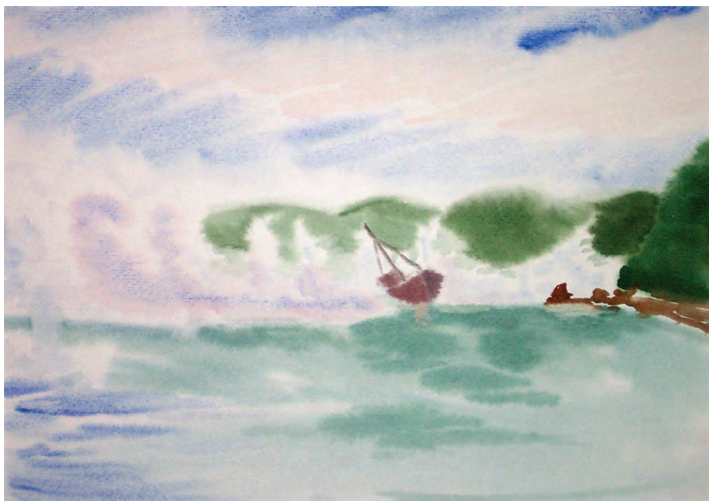
Туман уходит (2001)