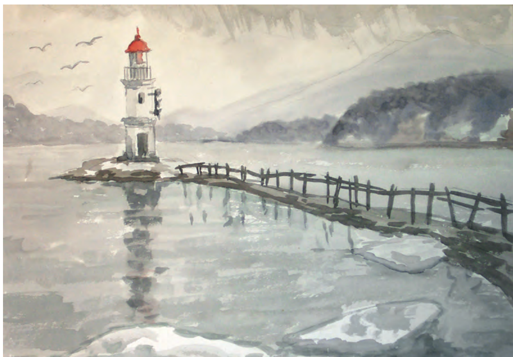
Маяк Токаревского весной (1991)