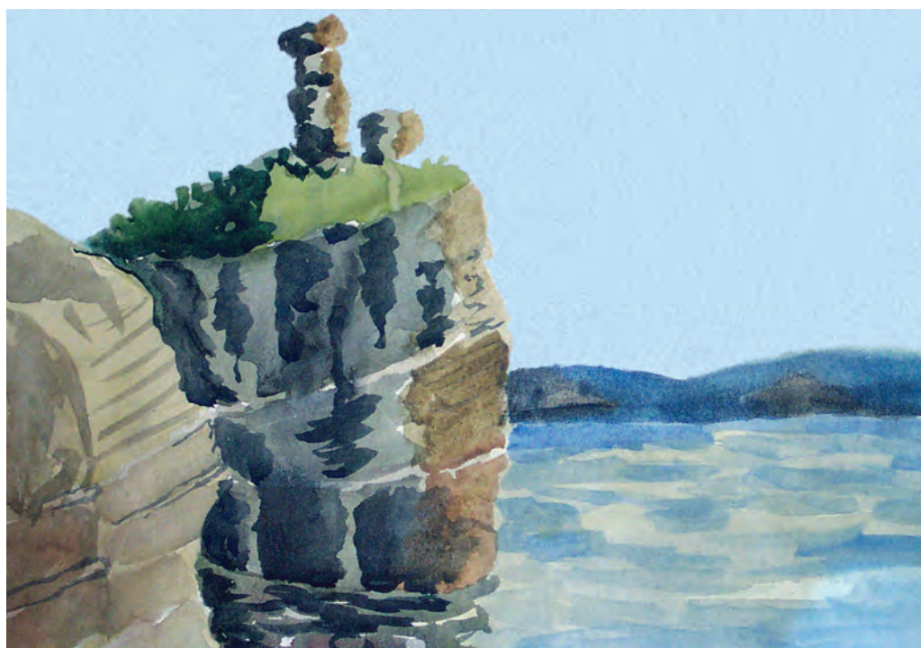
Островок вблизи полуострова Басаргин (1961)