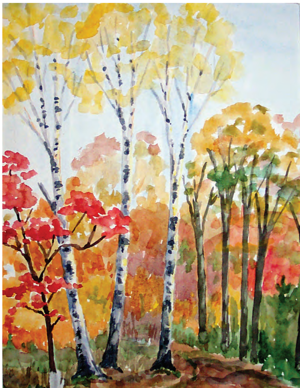
Начало осени (1996)