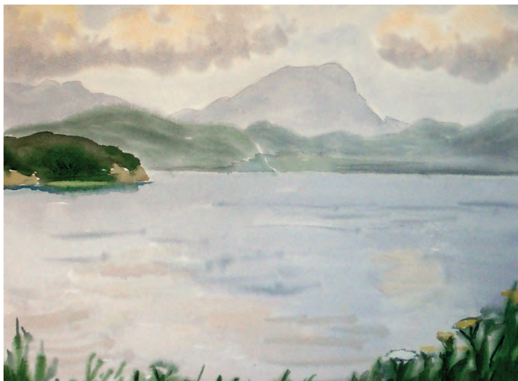
Покой и тишина. Залив Восток (1992)