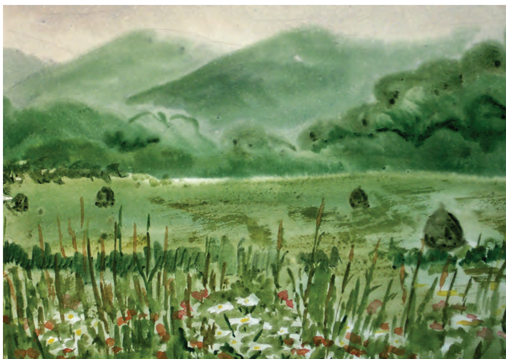
Приморское лето (1991)