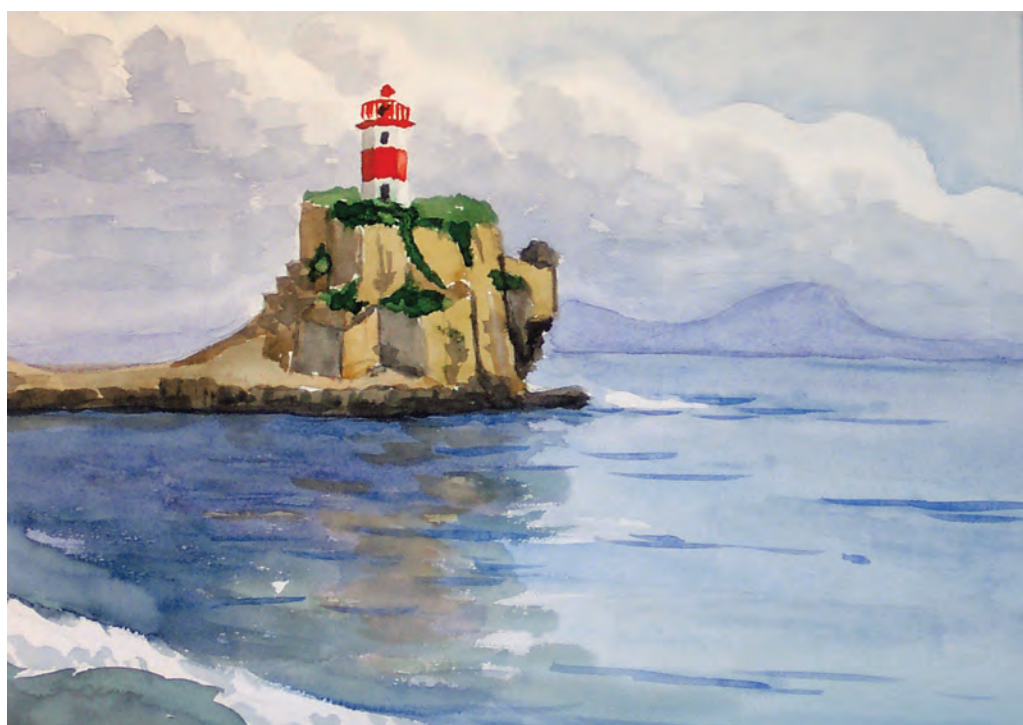
Маяк Басаргин (1991)