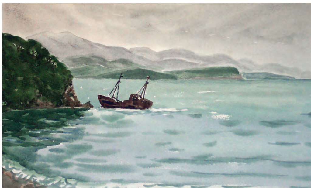
После шторма. Залив Восток (1993)