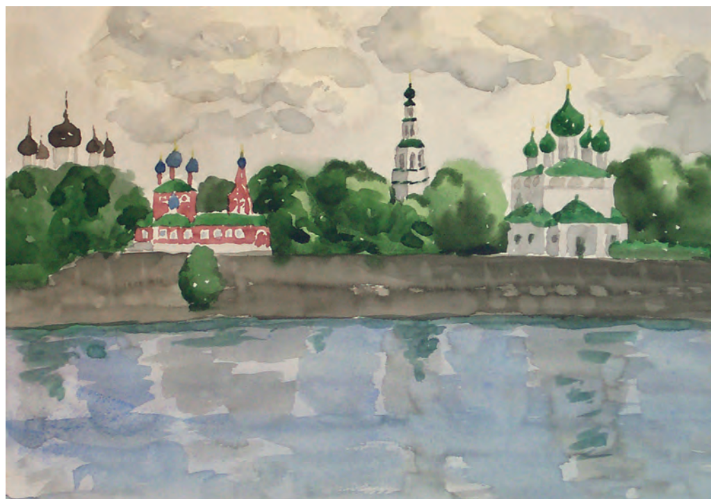
Углич. Вид на Кремль с Волги (акв., 1975)