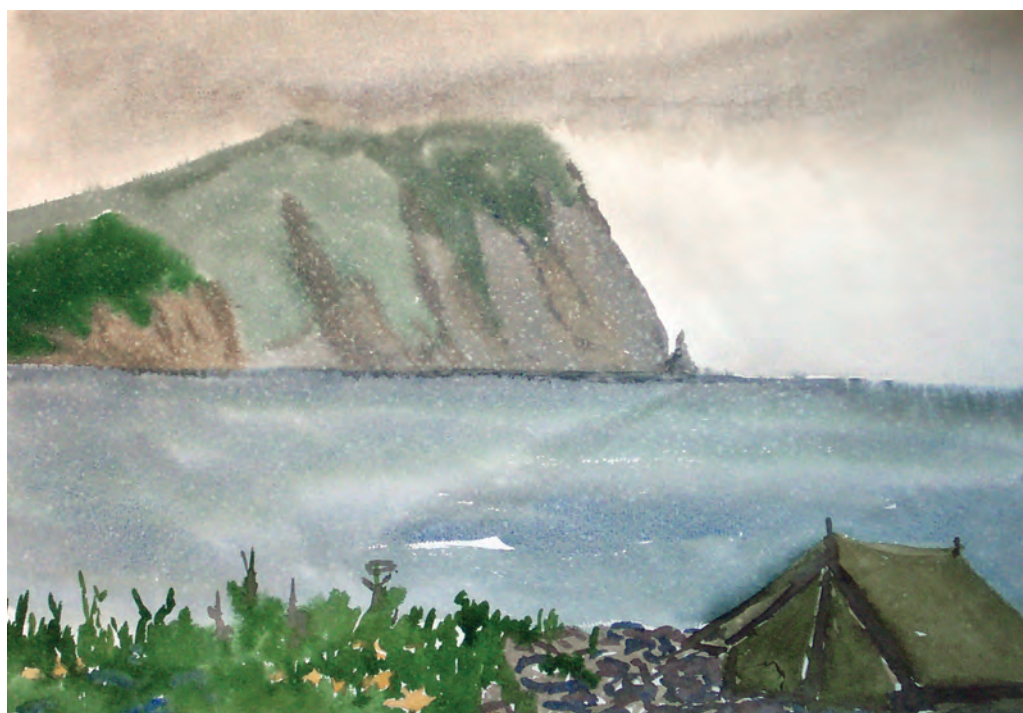
Бухта Китовое Ребро. Дождь (1984)