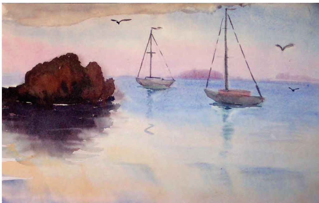
Яхты у острова Рикорда (1974)