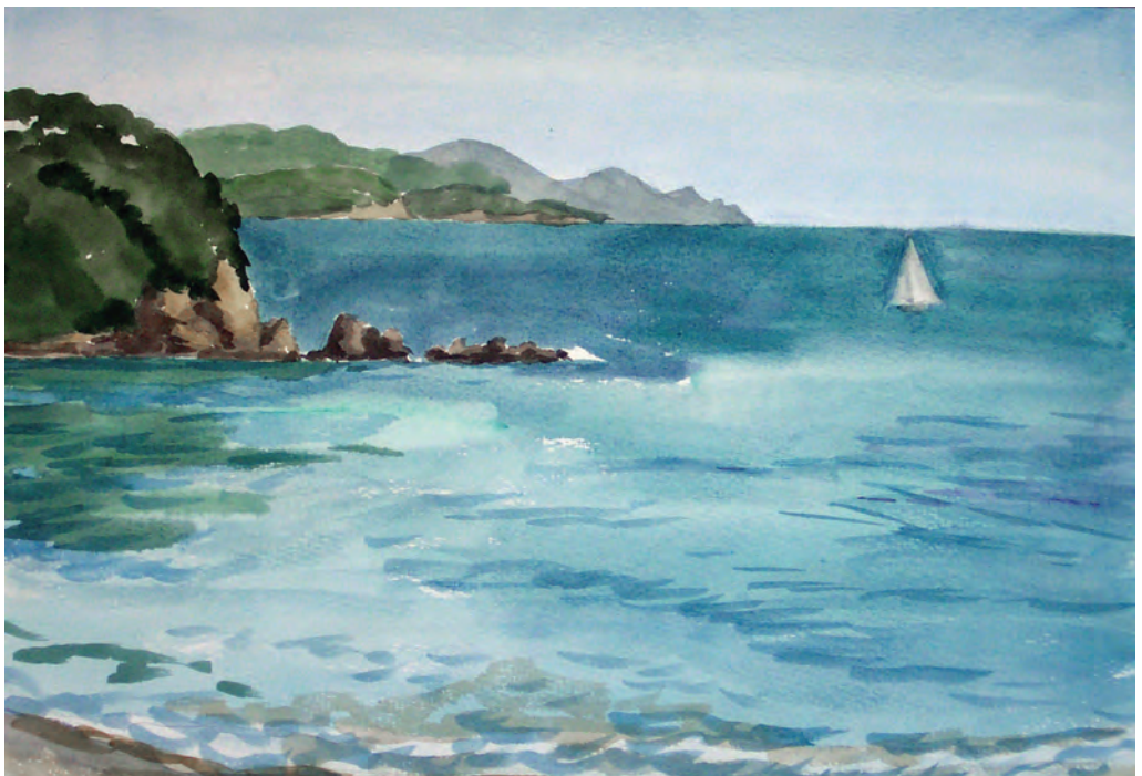
Залив Восток в октябре (1993)