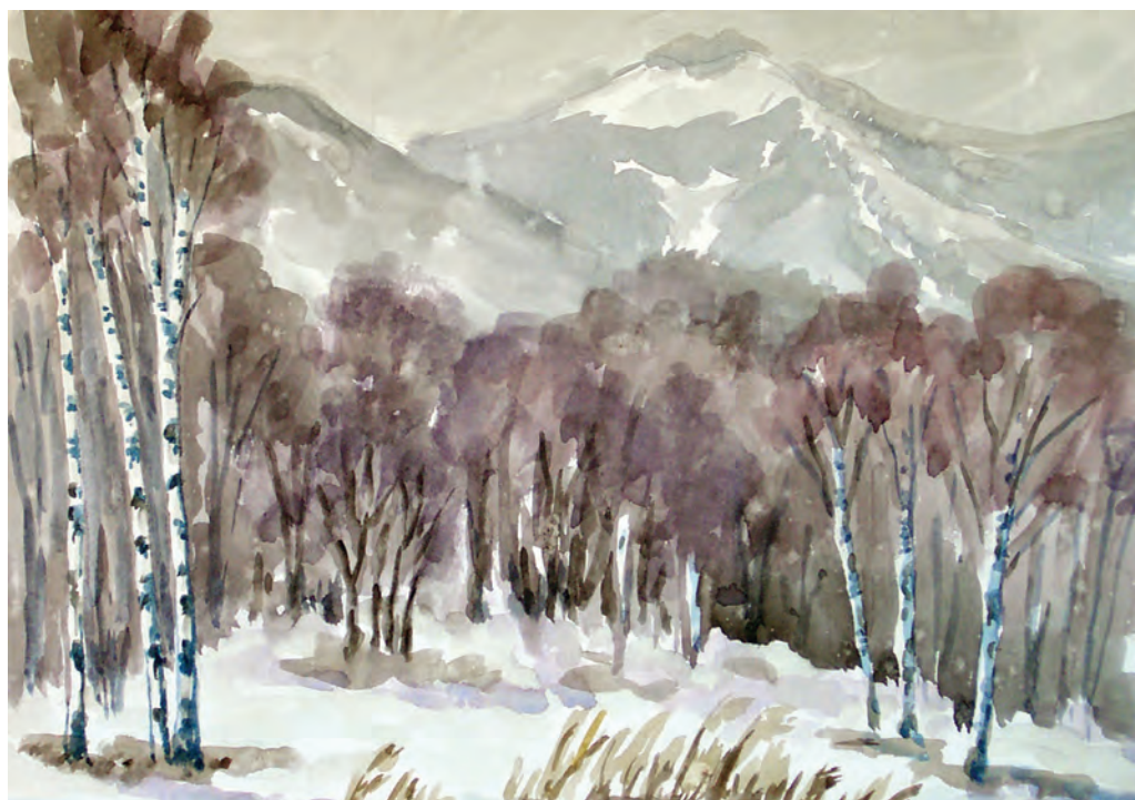
Март в предгорьях хребта Ливадийского (1995)