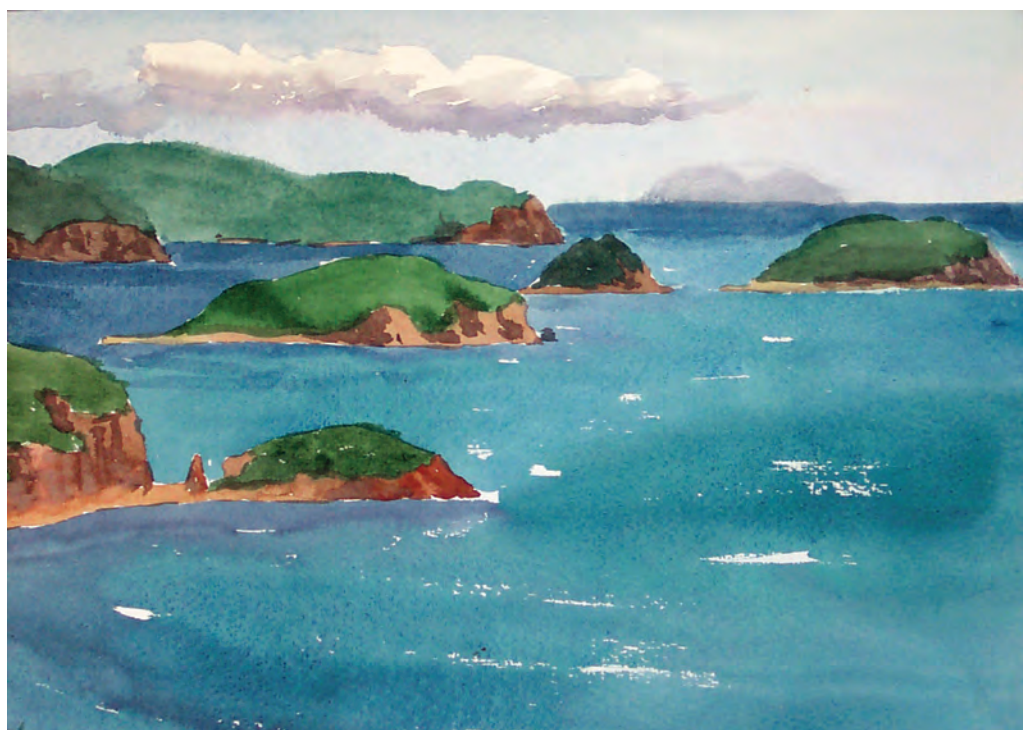
Голубые просторы (1981)