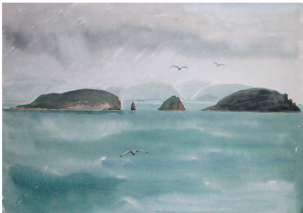
Вид на острова Клыкова, Малый, Наумова (1982)