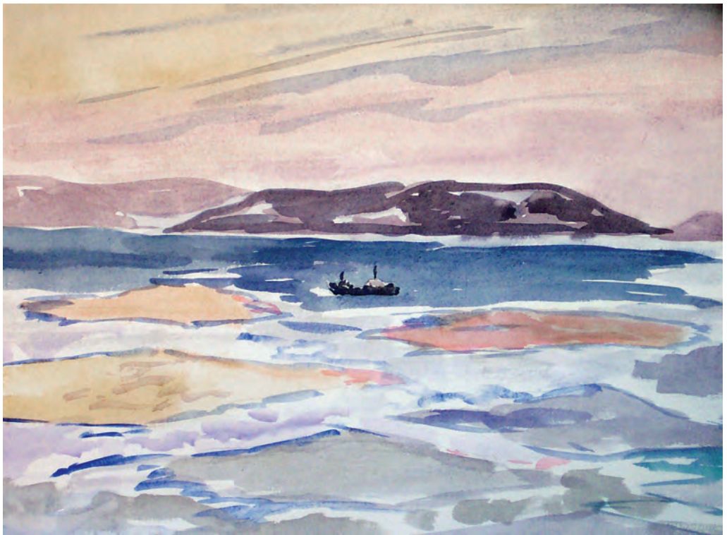
Замерзающий Амурский залив (1992)