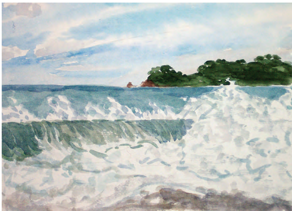
Прибой. Бухта Средняя (2004)