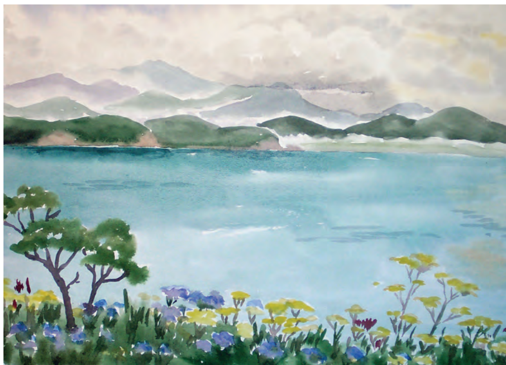
Залив Восток в цветах и туманах (1995)