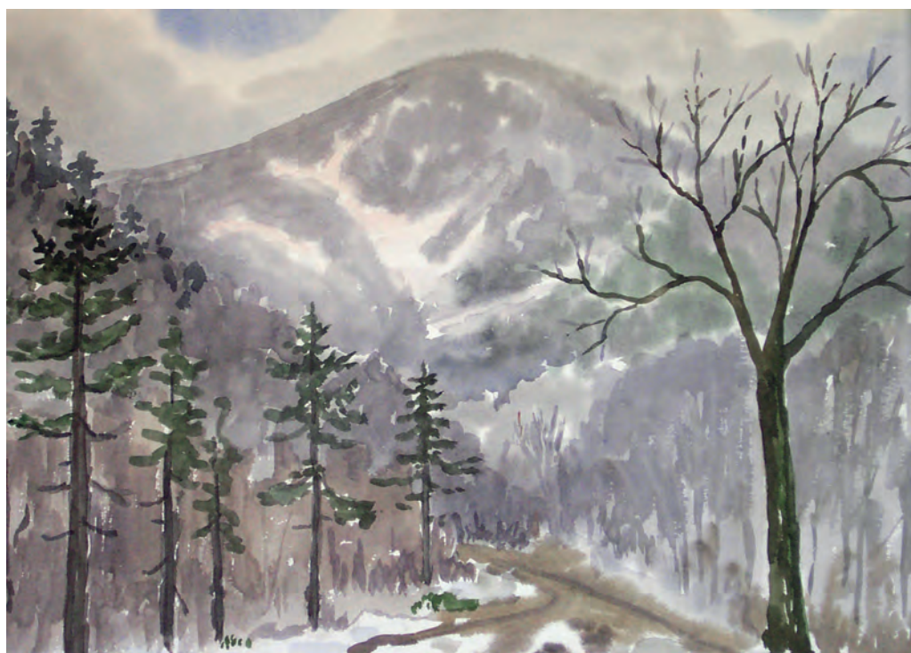
Ключ Смольный (1996)