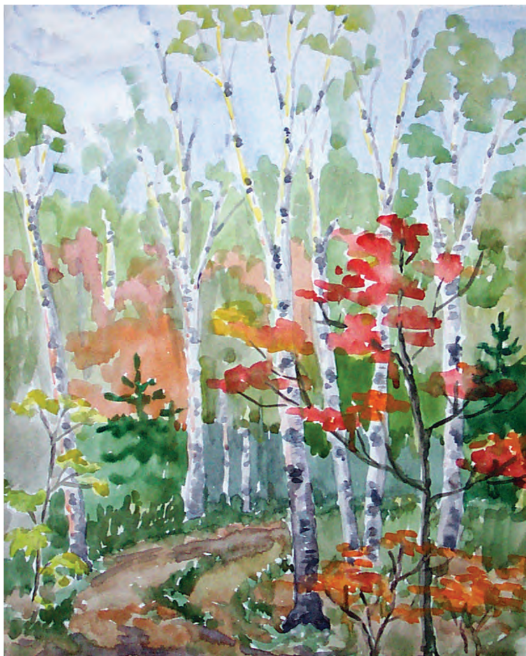
Осенняя краса (2002)