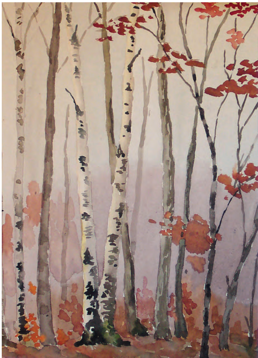
Утро туманное (1968)