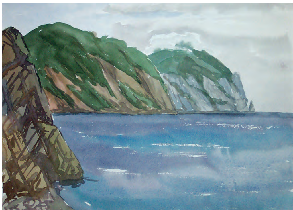
Мыс Грозный. Опричненский гранитный интрузив (1982)