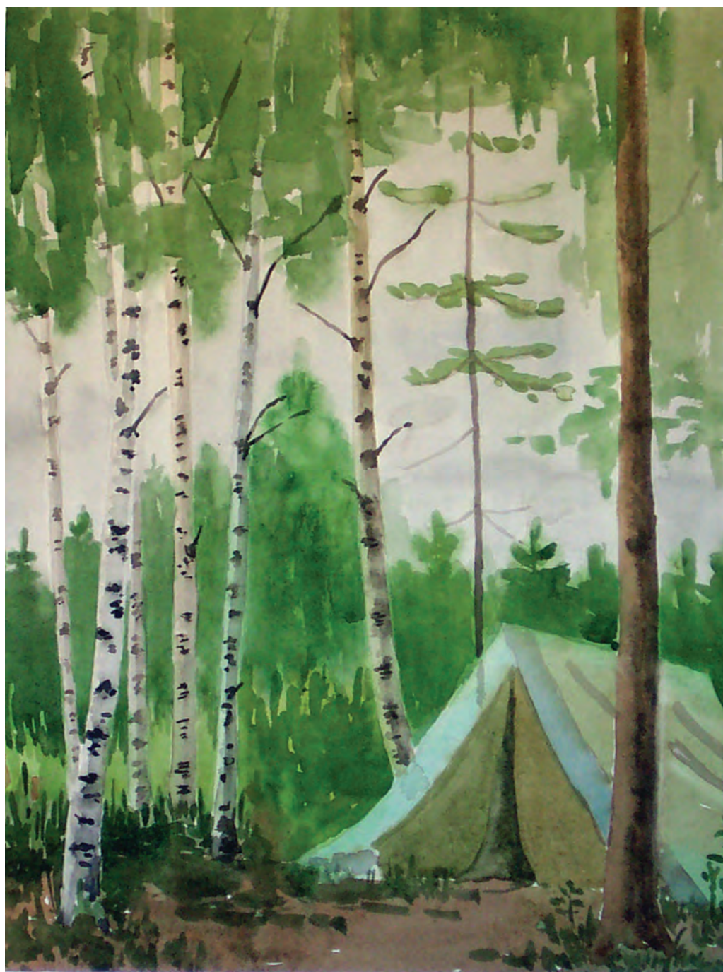
Уютный дом геолога (БАМ, Тында, 1976)