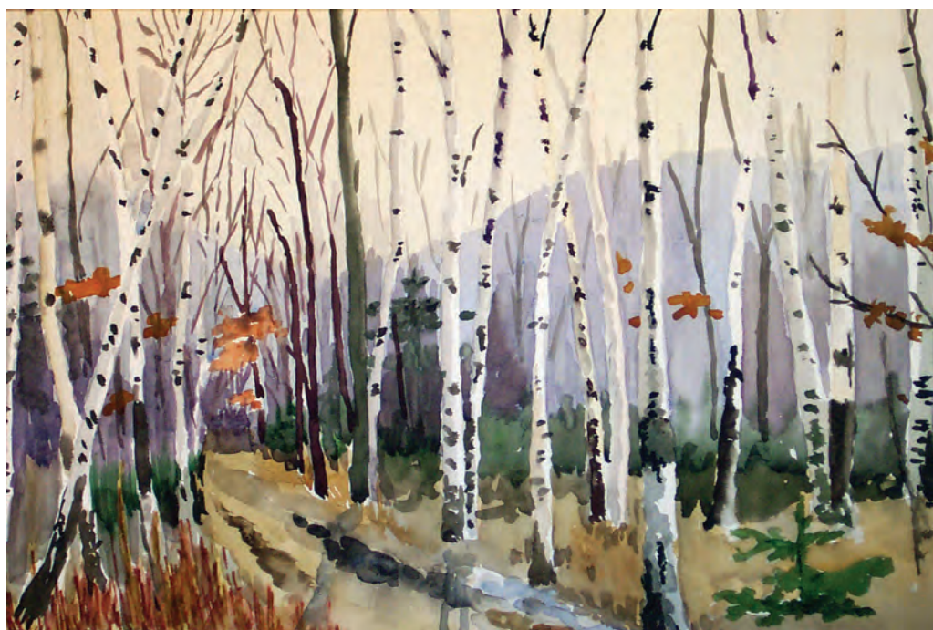
Березовый ситец (1968)