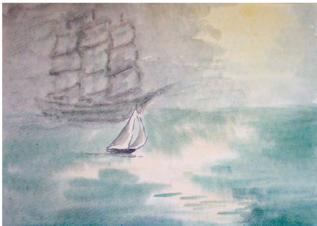
“Летучий голландец” (1995)