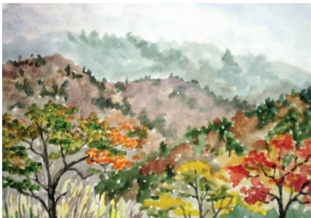
Осенняя палитра (1996)