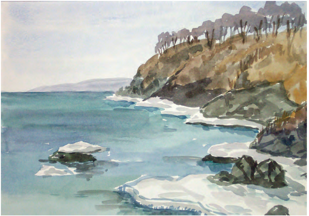
Уссурийский залив в белой окантовке (1998)