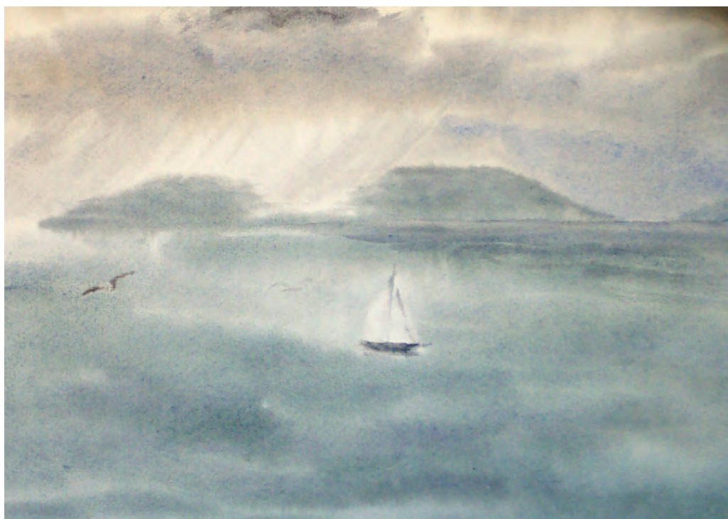
“Белеет парус одинокий ...” (1991)