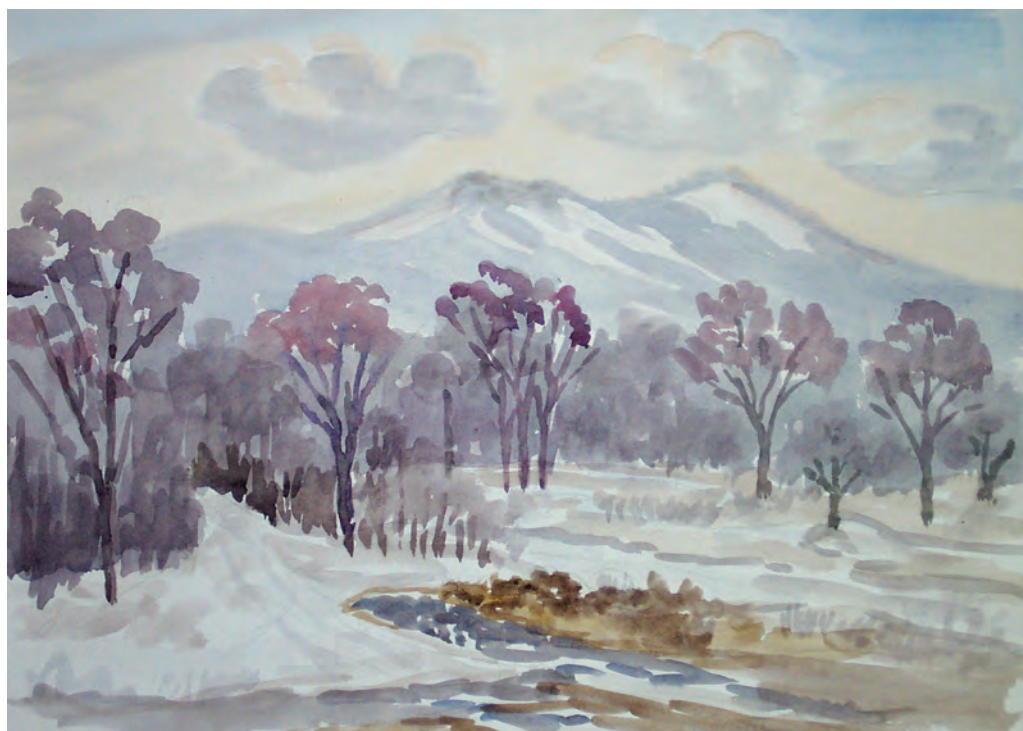
Любимый мотив (2004)