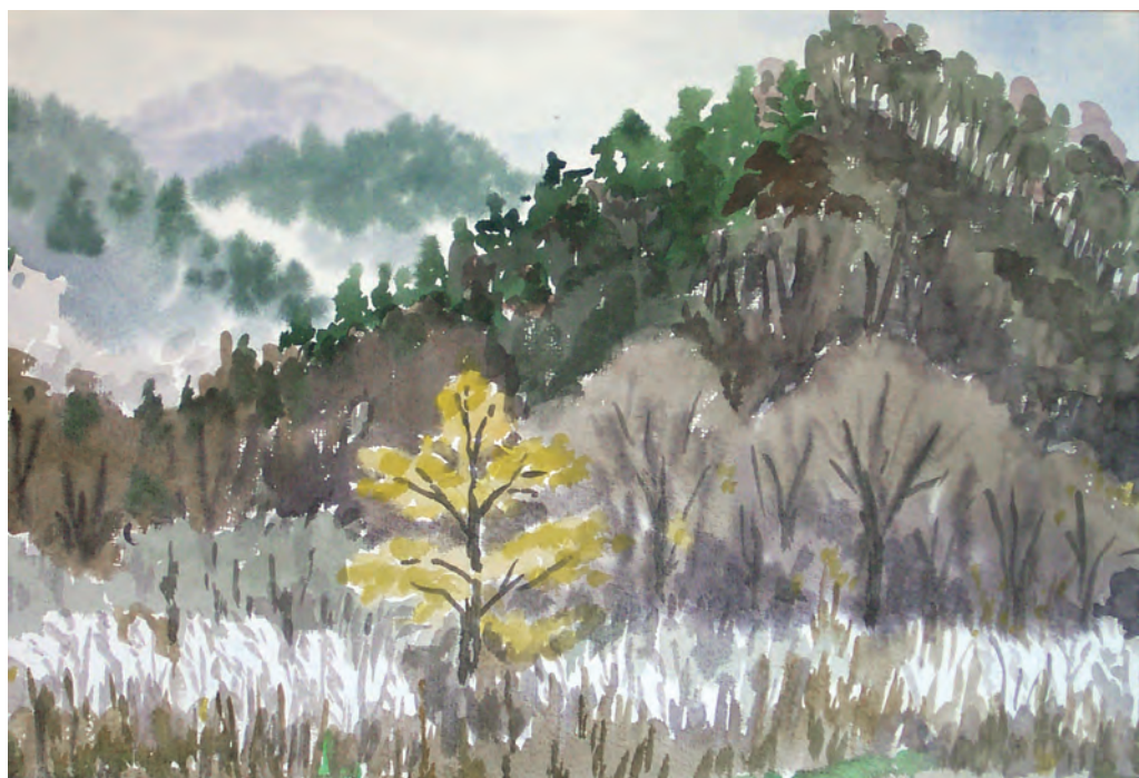
Осеннее утро. Ключ Березовый (1995)