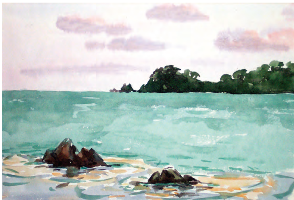
Зеленое море. Залив Восток (1995)