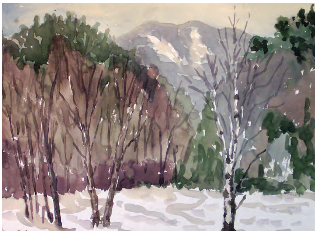
Вид на гору Литовка (Фалаза) из ключа Березового (1992)