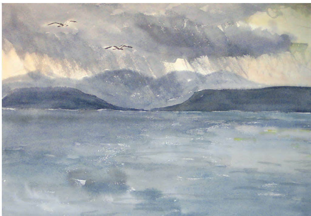
Майский дождь (1989)