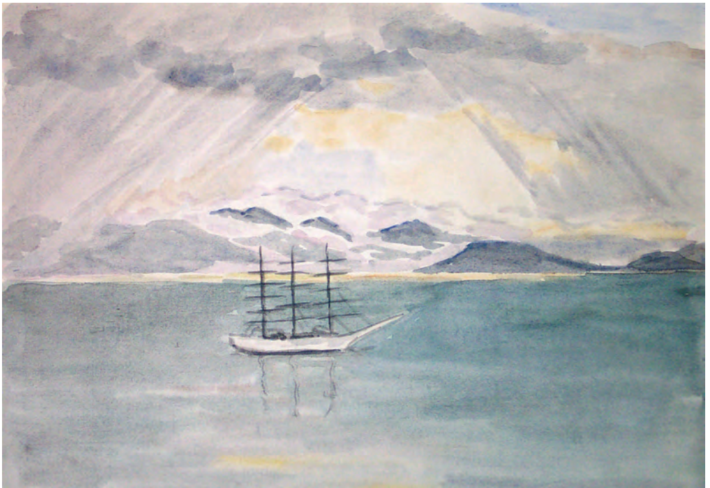
Лучи “Надежды” (1998)