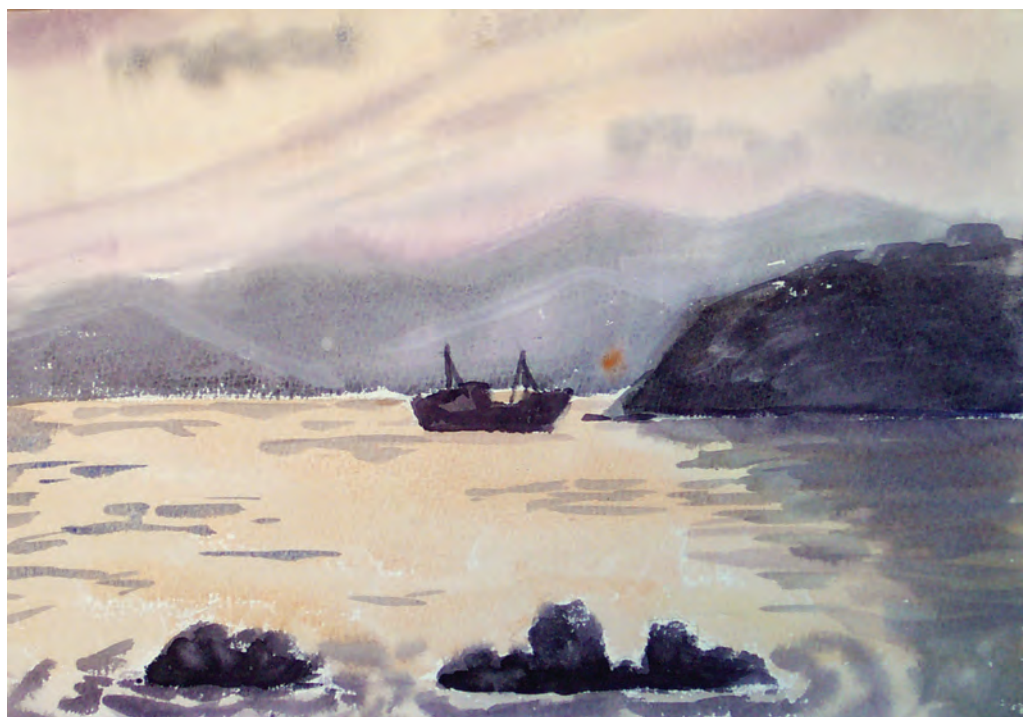
Золотой закат. Бухта Средняя (1993)