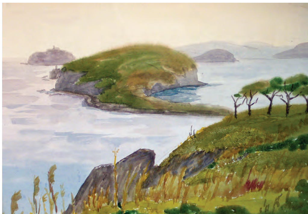
Полуостров Басаргин осенний, яркий (1990)