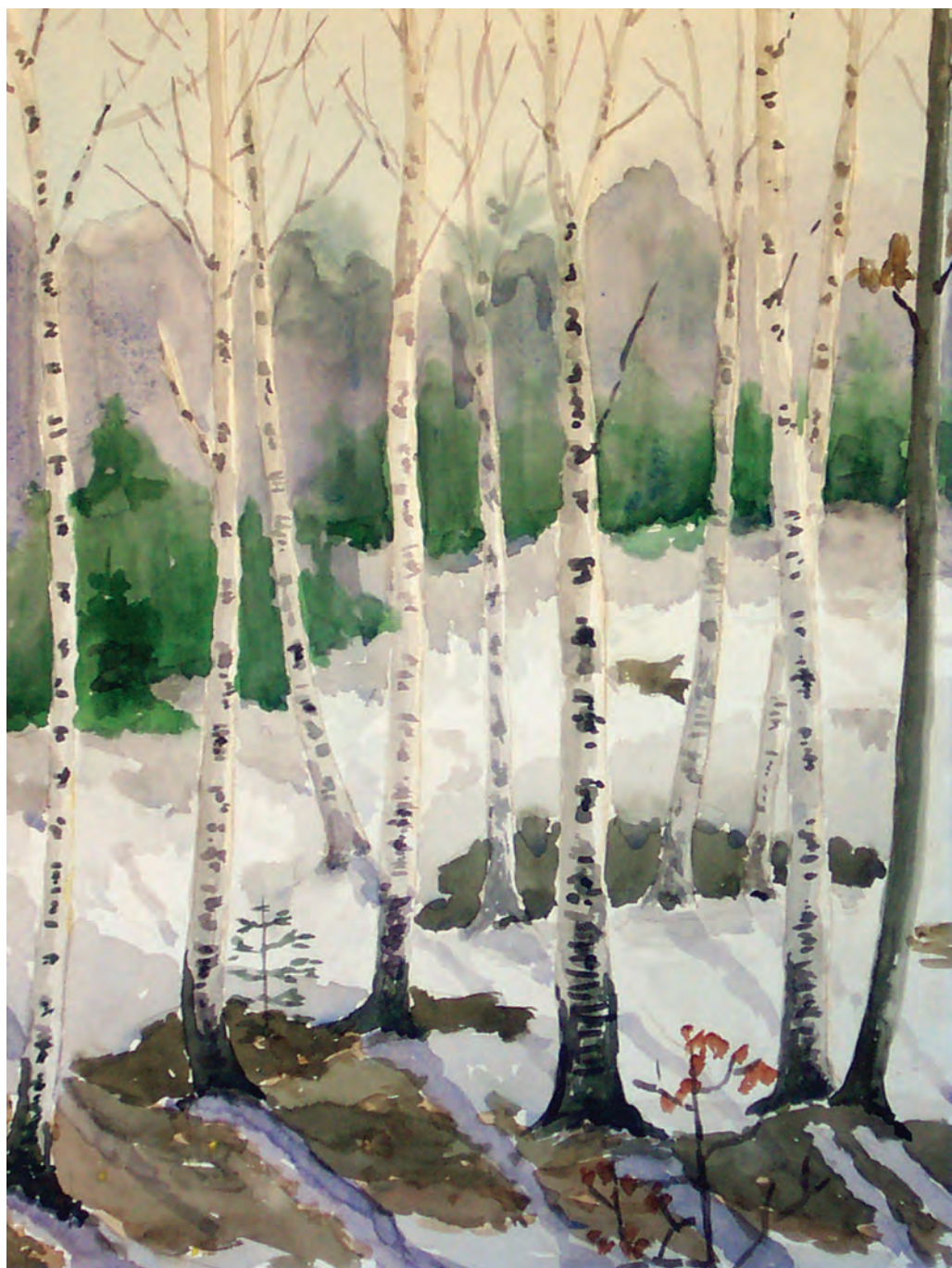
Последний снег (1979)