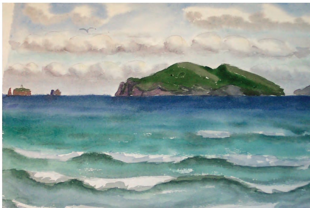
Свежий ветер в бухте Пограничная, остров Попов (1991)