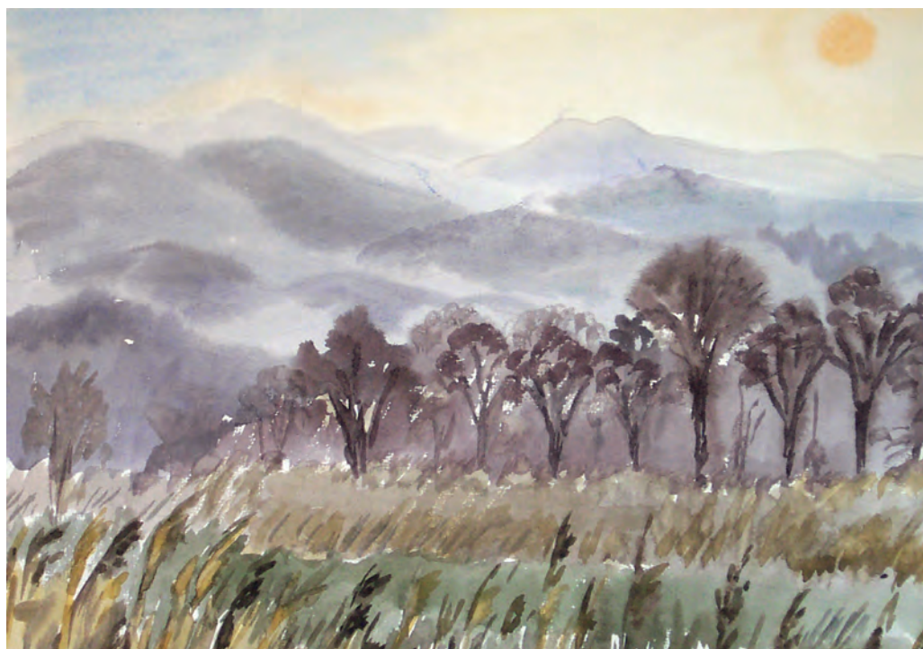
Задумчивый вечер (1995)