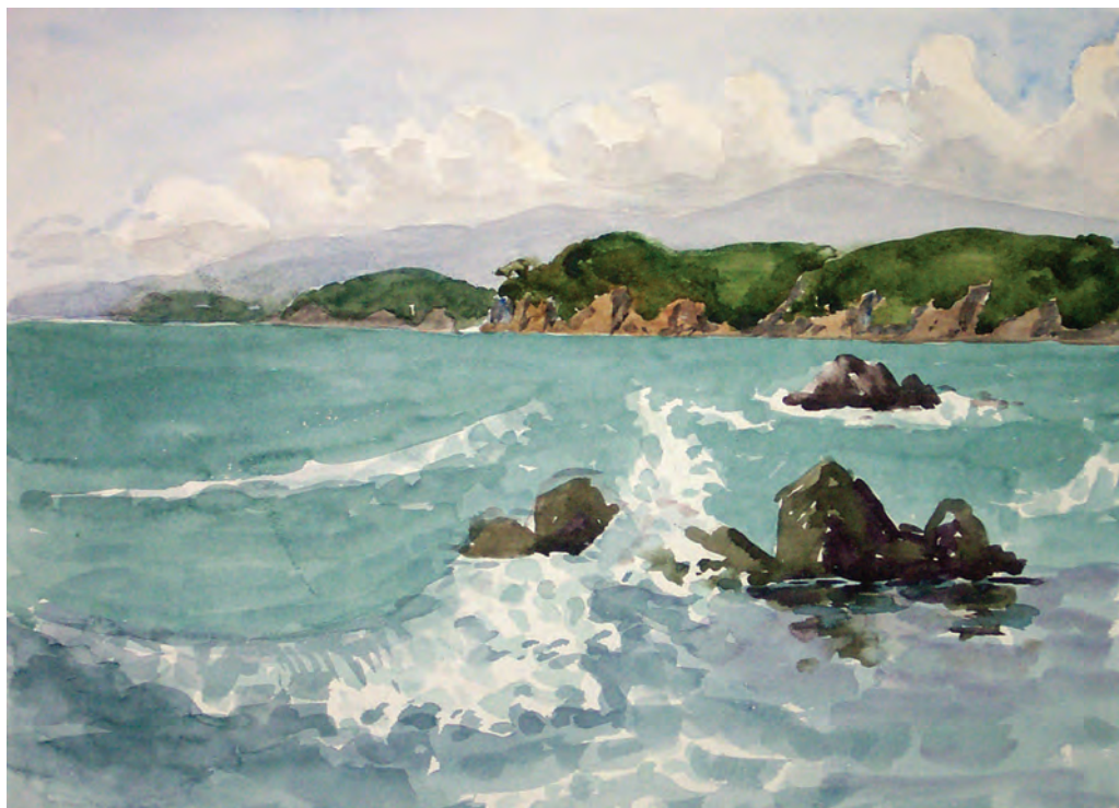
Волны и камни. Уссурийский залив (1997)