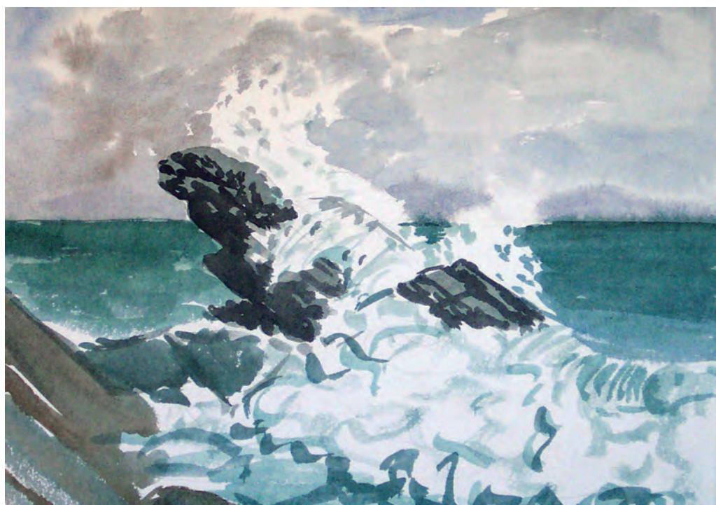
“О скалы грозные дробятся с ревом волны”. Уссурийский залив (1995)