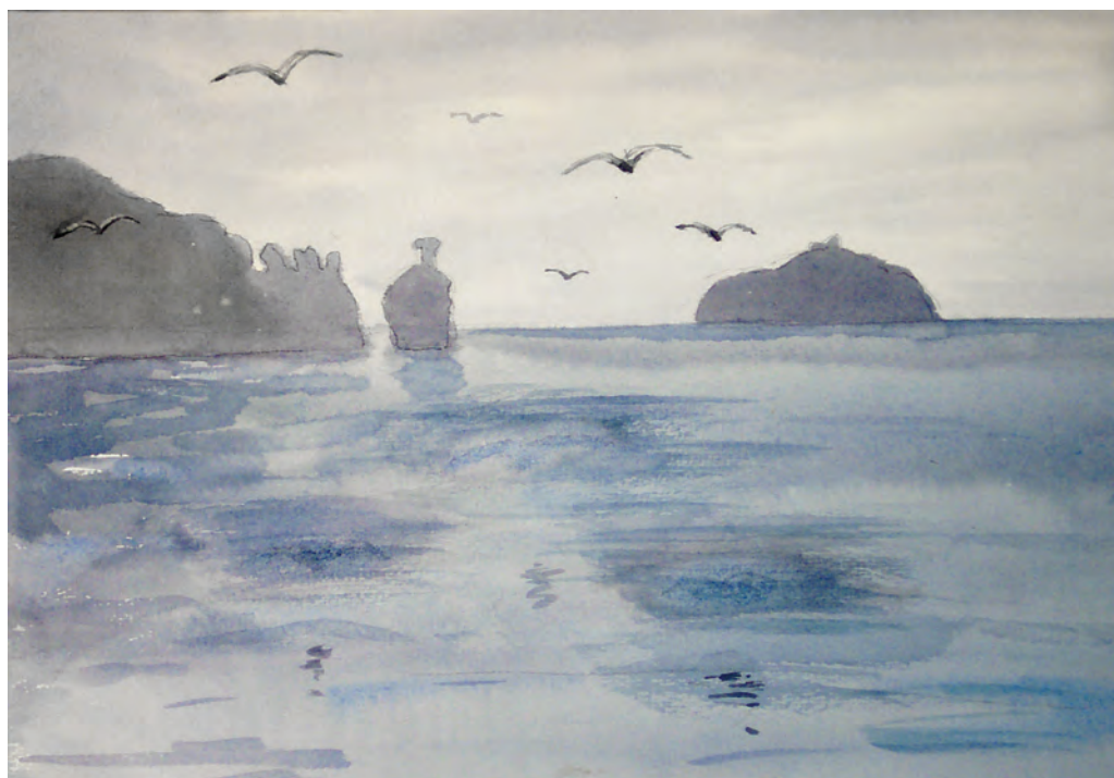
Бухта Патрокл (1988)