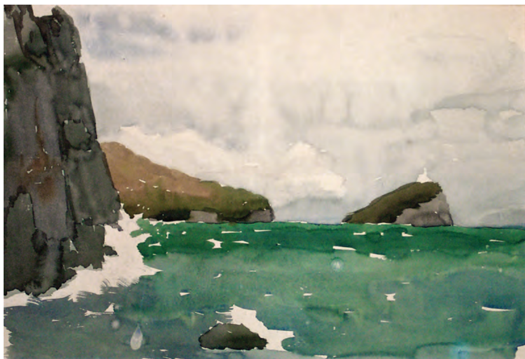
У входа в бухту Ольга (1966)