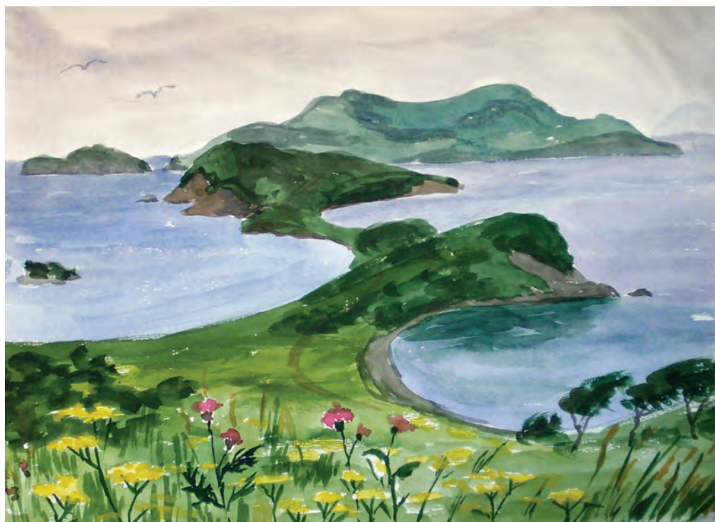
Прибрежные ритмы (1991)