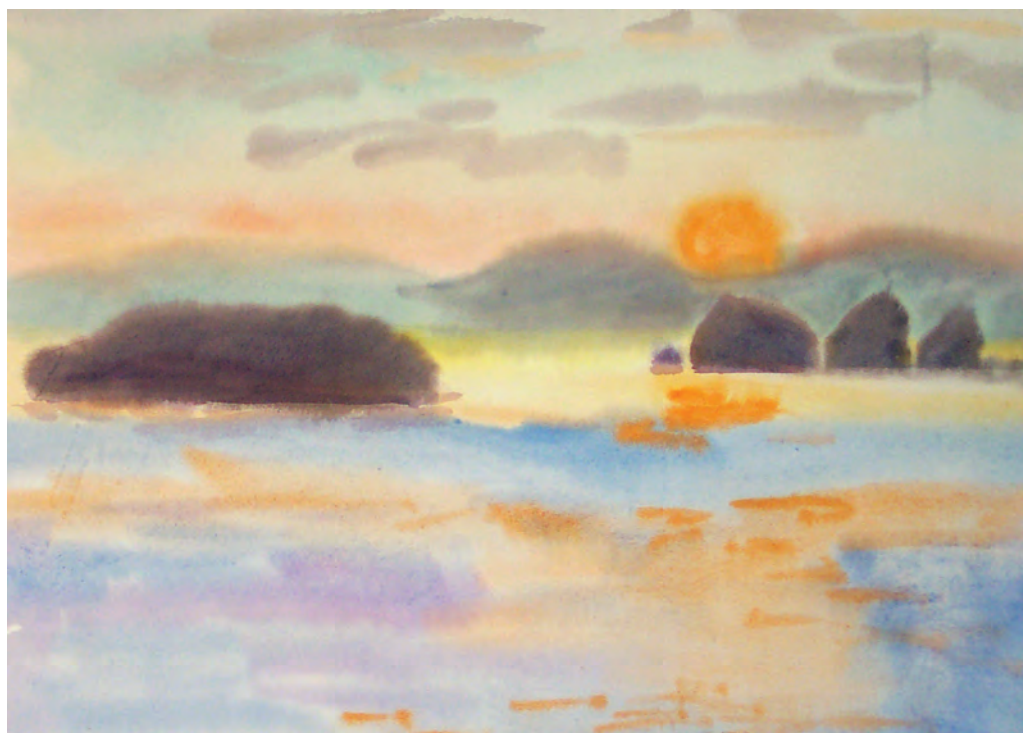
Закатное многоцветье (1983)