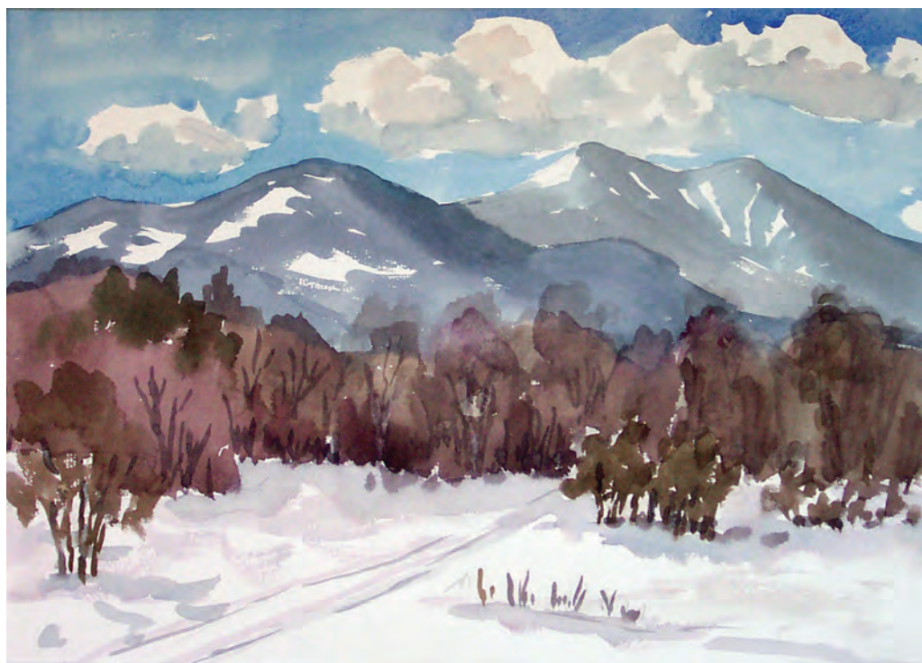
Март в предгорьях Литовки (2000)