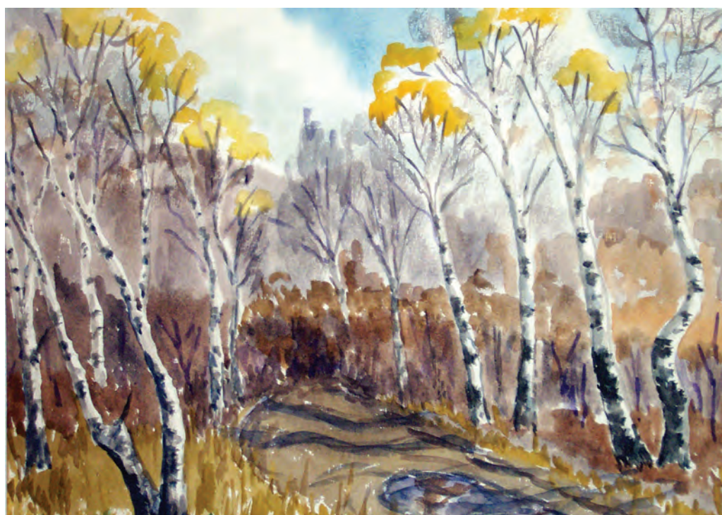
Осень на Аввакумовке (1993)