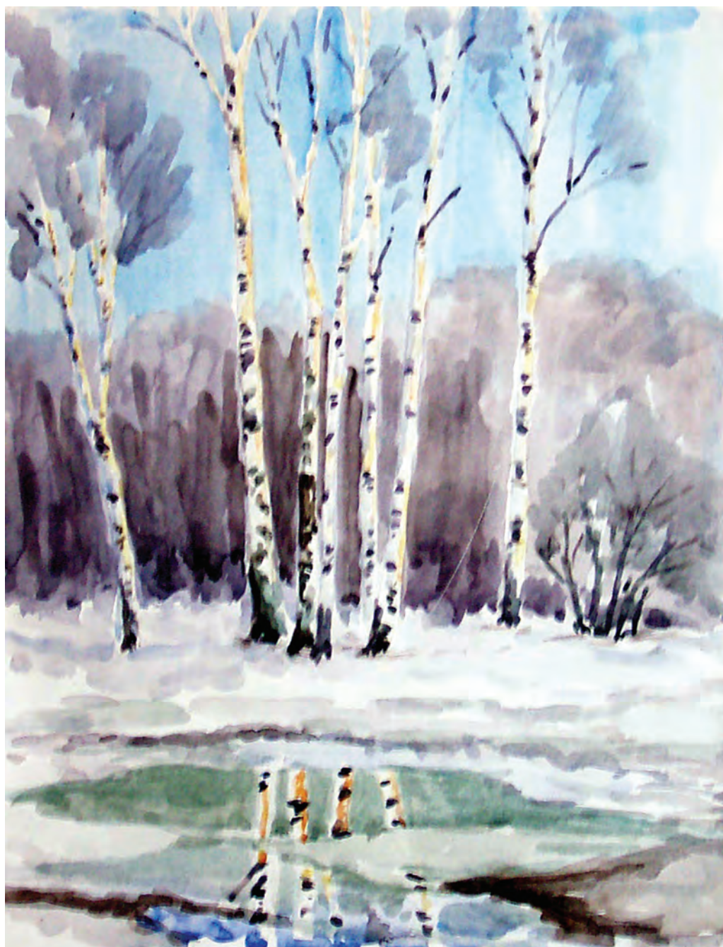
Весеннее зеркало (2003)