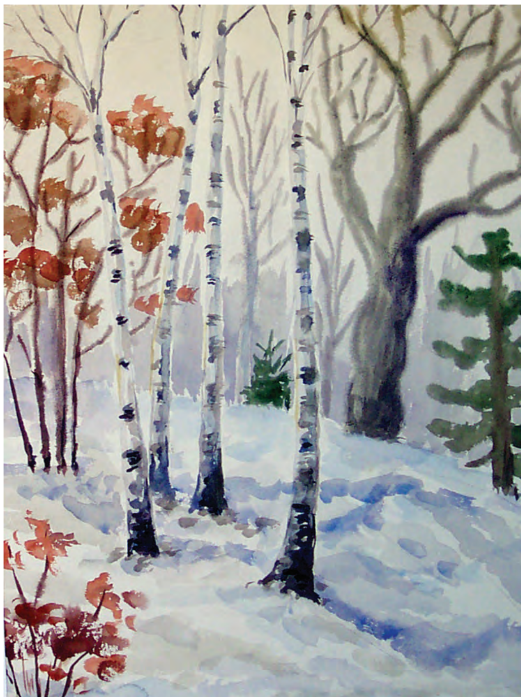
Декабрь на Океанской (1992)