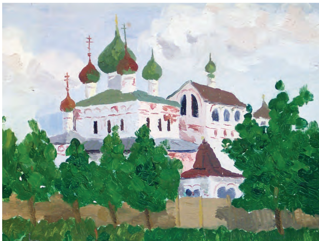
Углич. Воскресенский монастырь (масло, 1963)