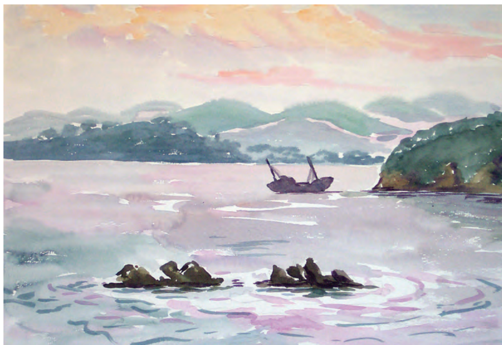
Сиреневый вечер. Бухта Средняя (1998)