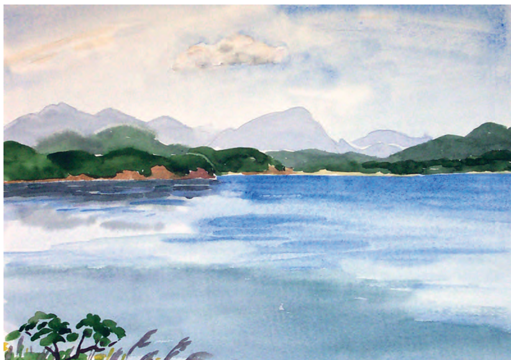
Утренняя синь. Залив Восток (1999)