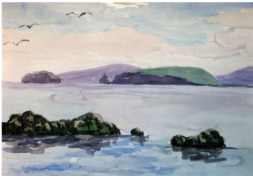
Вид на полуостров Басаргин и остров Скрыплёв (1983)