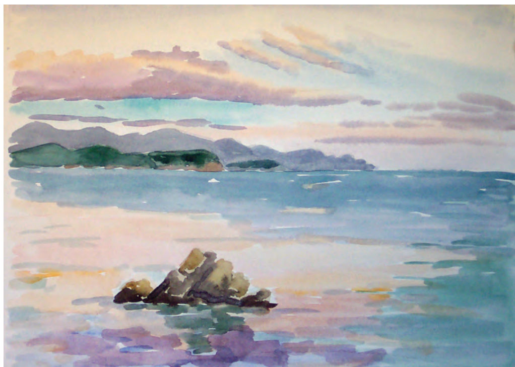
Тёплый вечер (2002)