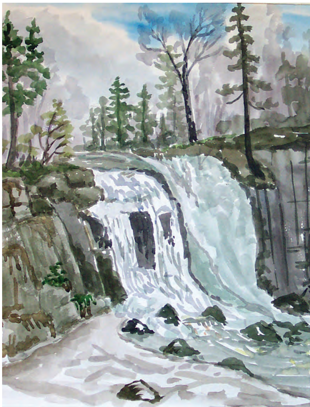
Водопад на Стеклянухе (2000)