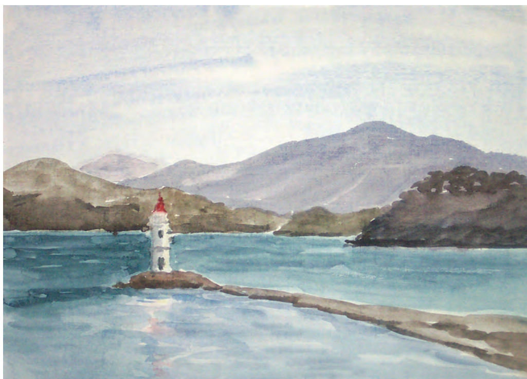
Токаревский маяк. Поздняя осень (1996)