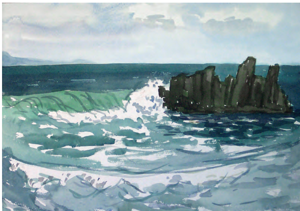
Морское кружево (1982)