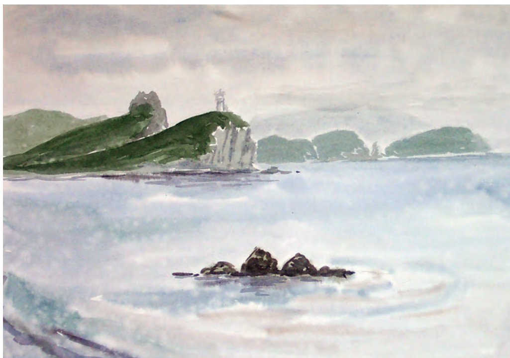
Бринеровский маяк (1998)