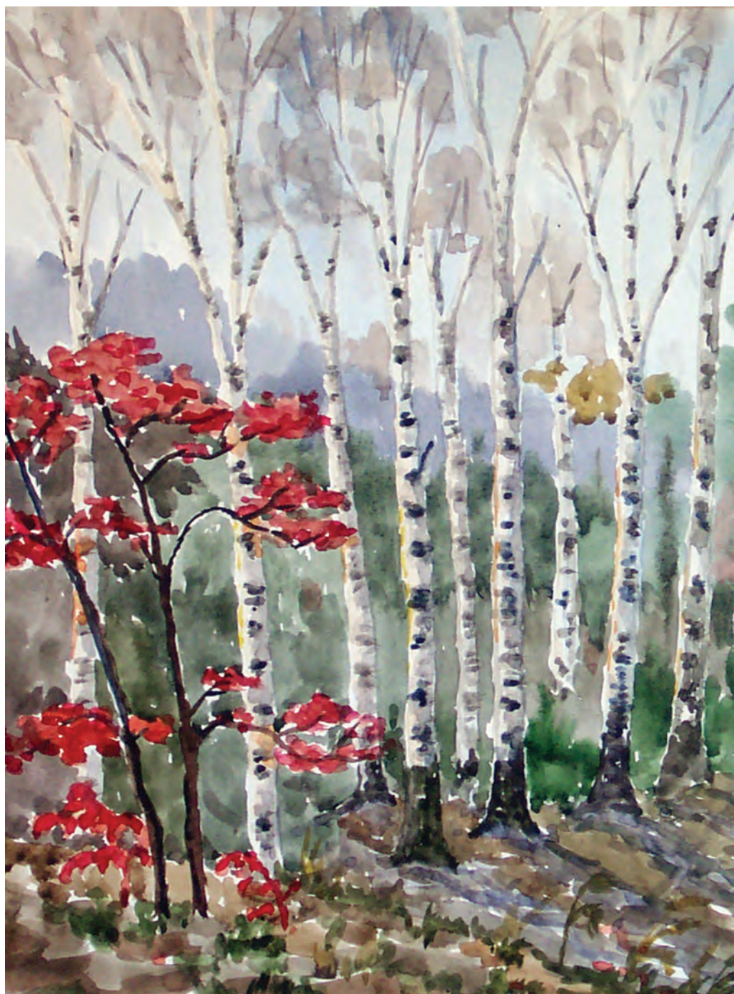
Осенний лес (1994)