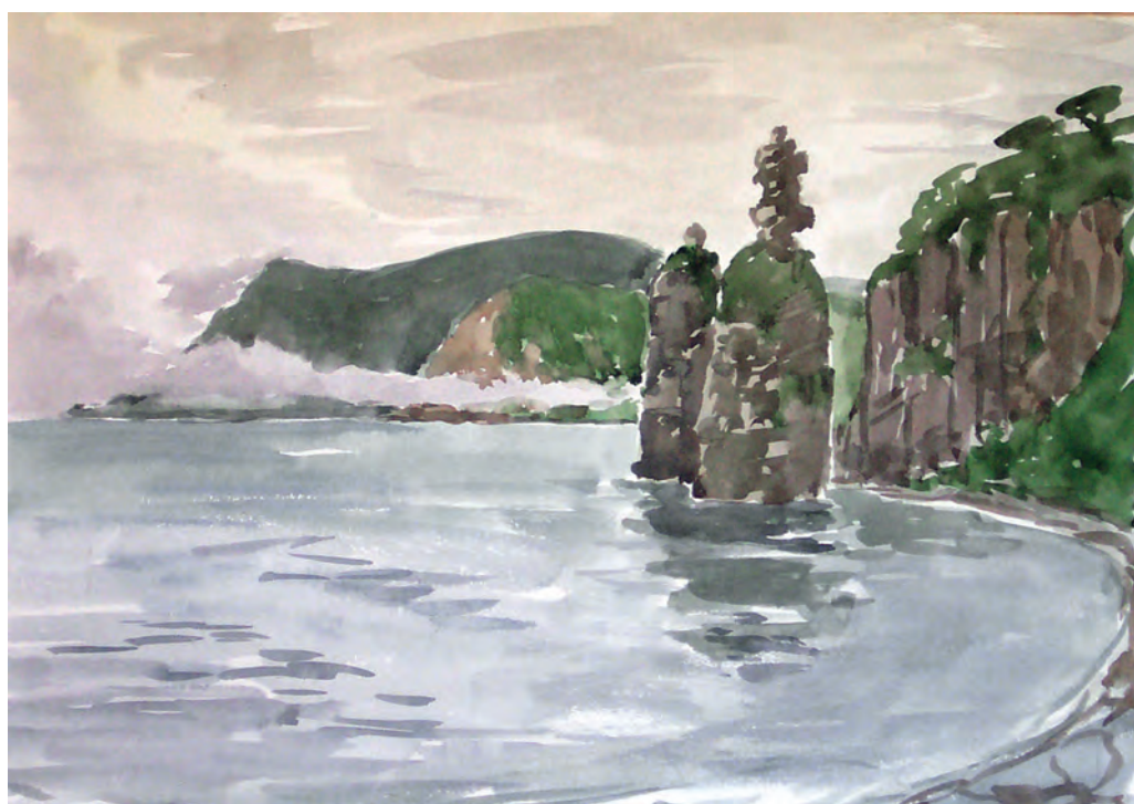
Кекур Церковь. Дальнегорский район (1994)