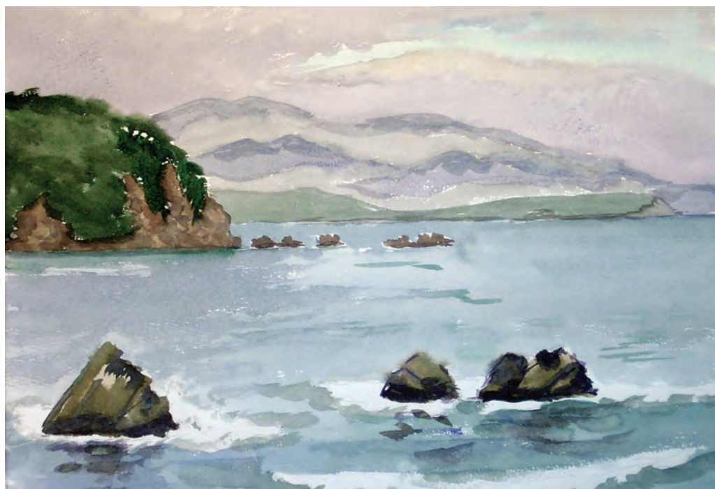
Уходящие туманы. Залив Восток (1992)